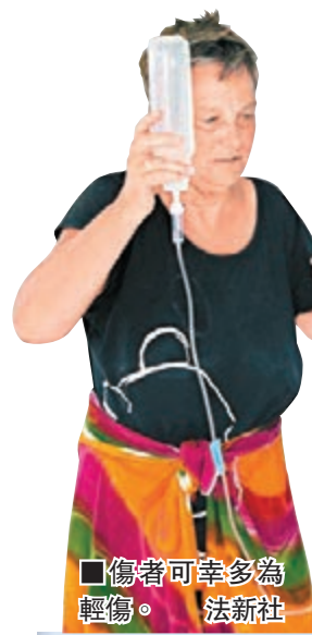
傷者可幸多為輕傷。