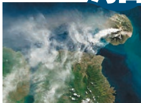
生還者游往有火山爆發的荒島，幸好不是大爆發。