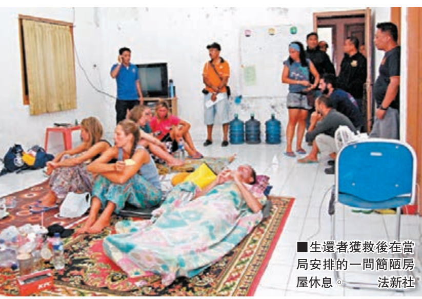
生還者獲救後在當局安排的一間簡陋房屋休息。

印尼一艘觀光船上周六在中部海域觸礁沉沒，船上20名外國遊客中18人已獲救，他們來自新西蘭、英國、西班牙、荷蘭、德國、法國和意大利，2人仍失蹤。生還者憶述驚險逃生經過，他們游泳長達6小時到附近一個荒島，靠飲尿和吃樹葉保命。