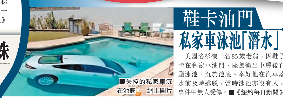
失控的私家車沉在池底。

美國洛杉磯一名85歲老翁，因鞋子卡在私家車油門，座駕衝出車房後直墮泳池，沉於池底。幸好他在汽車落水前及時逃脫，當時泳池亦沒有人，事件中無人受傷。