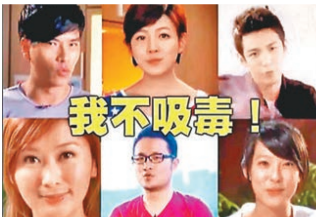
柯震東在宣傳片中均高喊「我不吸毒！」。