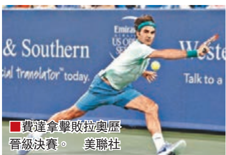
■費達拿擊敗拉奧歷晉級決賽。

瑞士網球天王費達拿周六於辛辛那提大師賽4強，以6:2及6:3擊敗加拿大球手拉奧歷，第6度躋身決賽，將與力克法國球手班尼迪奧的西班牙球手費拿爭冠軍。過往「費天王」已五度捧盃，入決賽後勝率更高達百分之百，今次第6度衝冠高唱入雲。