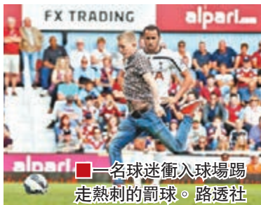
■一名球迷衝入球場踢走熱刺的罰球。