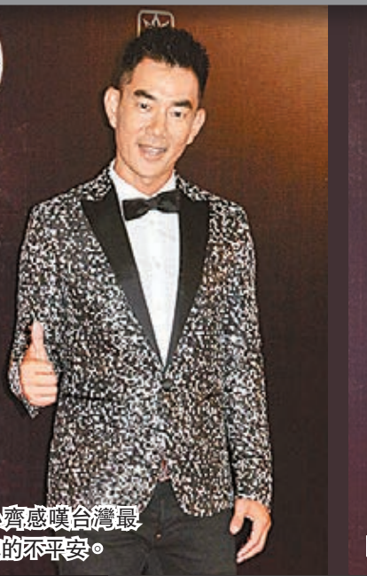
小齊感嘆台灣最近真的不平安。