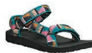
Teva Original Universal

在夏日穿上涼快的拖鞋，早已成為時尚有型的打扮之一，而來自巴西的著名拖鞋品牌 iPANEMA，每季都會推出多個創新、好玩又趣味十足的拖鞋系列。品牌深明女士們貪新鮮和追求新事物的心態，故特別推出可以轉換配飾的拖鞋系列，多款用色鮮艷的人字拖，特別之處在於人字帶上的配飾可自行轉換，每款備有多個配飾，分別是心型、甲蟲和蝴蝶結，造型別致可愛，讓你隨意轉換，並配襯不同服飾，為夏日增添樂趣與創意。每年夏天，品牌均推出一系列鴛鴦圖案拖鞋，而且每次都會成為皇牌熱賣產品。今季品牌出品的鴛鴦圖案拖鞋，部分款式的鞋帶更首次用上夜光物料，身處黑暗中會隱隱散發光芒，讓雙腳即時聚焦，成為眾人焦點。