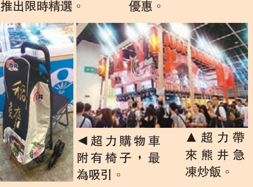
超力購物車附有椅子，最為吸引。