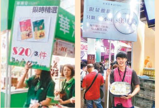
華潤堂每天不定時推出限時精選。

在此，筆者於首天進內，為大家搜羅了部分優惠及新產品。當中最吸引筆者的是，馬來西亞大廚 Uncle Sun 推出的「特辣白咖喱麵」和「白咖喱麵」。秘製辣椒醬由多種天然食材如乾蝦米、紅蔥頭、大蒜、辣椒、香茅及精製鮮蝦醬等熬製而成，會場價 $49/2 袋，送金蘭高級生抽 1L 裝 (乙支)。