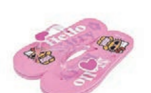
Arena x Hello Kitty

Teva 也特別推出充滿夏日色彩的 Original Universal 和 Original Sport Sandal 經典復刻版運動涼鞋，用上搶眼的顏色，打造出型格又舒適的涼鞋。Original Universal 以夏天撞色系列為主，鞋底採用 Durabrasion Rubber 製造，長時間走於崎嶇不平的路面都不易磨損，還用上 EVA 橡膠鞋床，輕巧柔軟，承托力十足。而 Original Sandal 亦推出單色系列，特色是鞋面上直立式織帶設計，不會刮腳，方便配合腳型調較鬆緊。