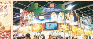
韓風大熱，來自韓國柚子茶買 2 樽送蜂蜜蘆薈柚子茶 1 樽。