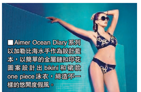
Aimer Ocean Diary系列以加勒比海水手作為設計藍本，以簡單的金屬鏈扣印花圖案設計出 bikini 和裙款 one piece 泳衣，締造不一樣的悠閒度假風。

近年的泳裝都以比堅尼作主打，款式更是推陳出新，有不少剪裁獨特、顏色和圖案奪目的設計，性感又具玩味。至於一件頭的泳裝亦轉趨時尚化，Deep V 剪裁，增強胸部的立體線條效果，配上 X 形及腰側鏤空設計，塑造腰間的誘人曲線；有些更結合嶄新泳裝科技及泳裝潮流，專業、時尚與實用兼備。