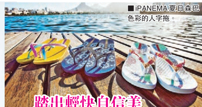
iPANEMA 夏日森巴色彩的人字拖。