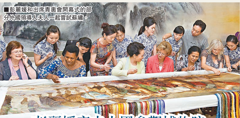
彭麗媛和出席青奧會開幕式的部分外國領導人夫人一起嘗試蘇繡。

請拿出你們的智能手機,讓我們一起創一項自拍記錄。發送這張加上「YOG」主題的自拍照,你們將向世界發出一個強有力的信息。隨後,幾名運動員登場,圍着巴赫主席一起自拍。現場觀眾也參與互動,紛紛拿出手機,做出各種表情自拍。 ■記者 楊明奇、許娣聞 南京報道