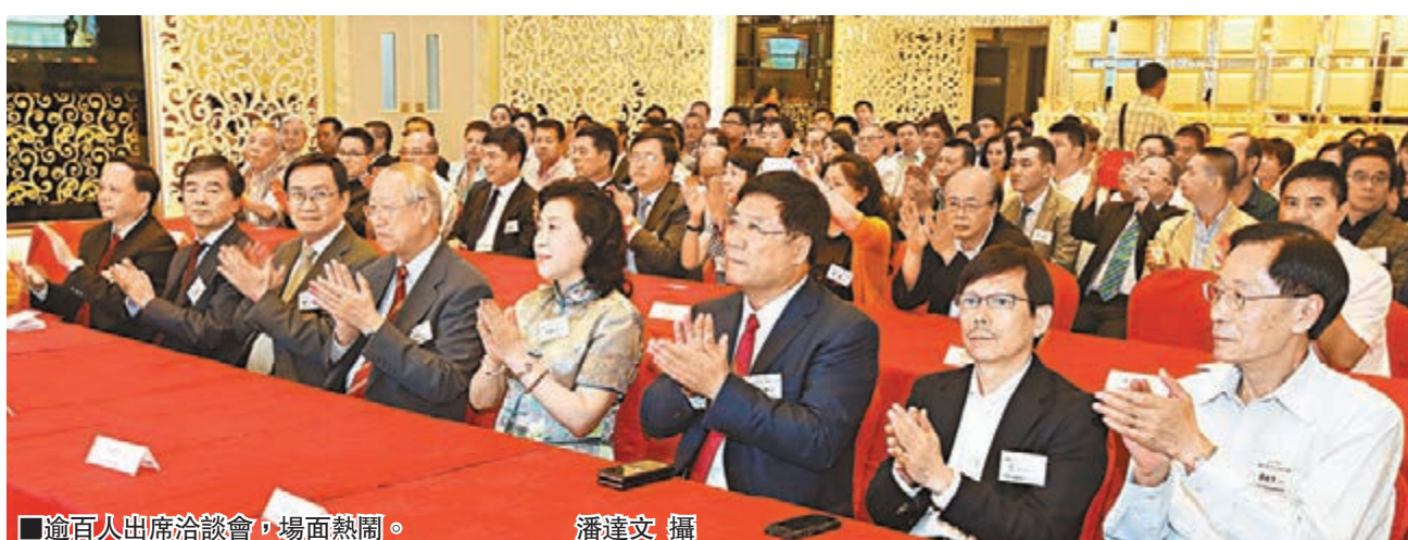
逾百人出席洽談會,場面熱鬧。