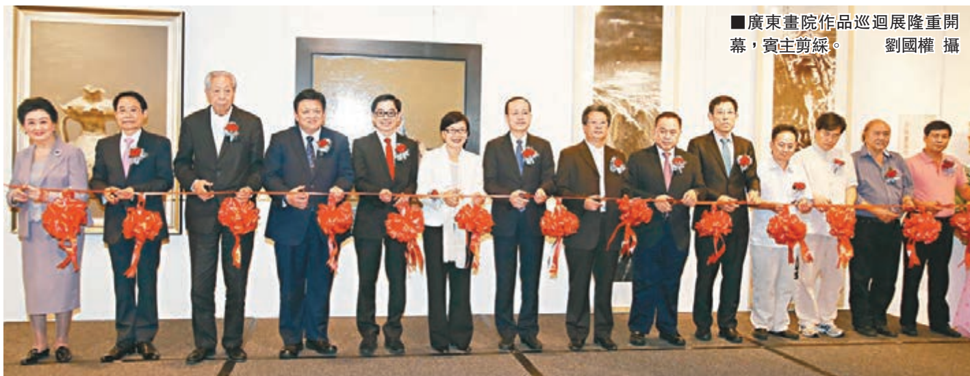
廣東畫院作品巡迴展隆重開幕,賓主剪綵。