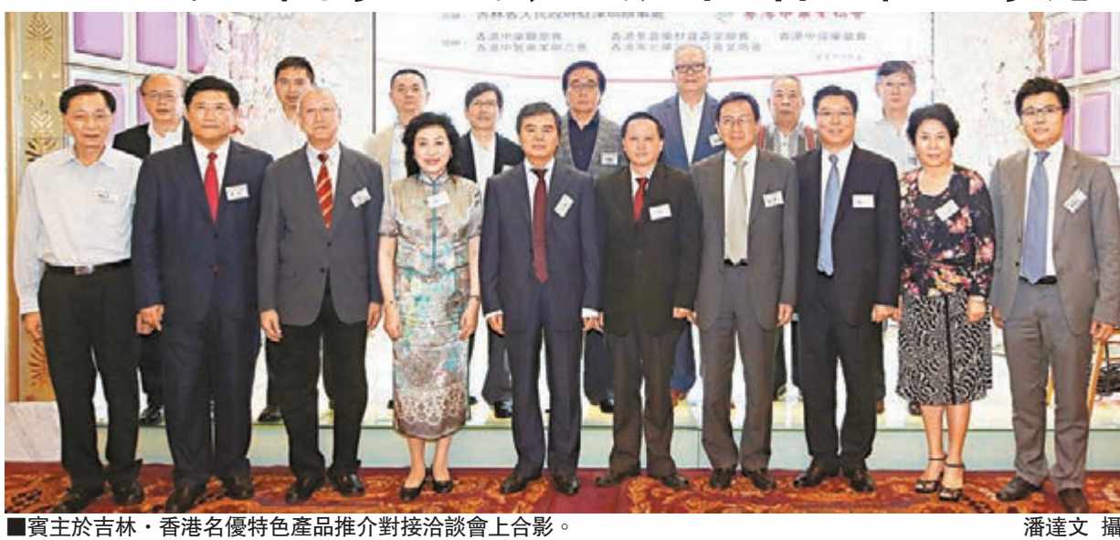
賓主於吉林·香港名優特產產品推介對接洽談會上合影。