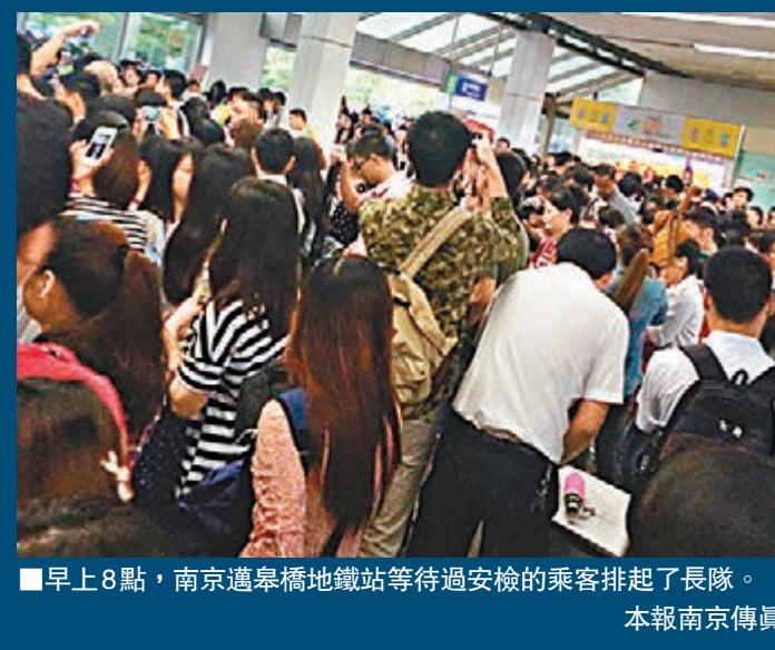
早上8點,南京邁皋橋地鐵站等待過安檢的乘客排起了長隊。

火車站和地鐵之外,公交站和公車站也是安保重點。昨日在市中心的公交站都有一至兩名戴着紅袖標的學生志願者維持秩序。而巴士上也有安檢人員。在100路巴士的志願者說,他們每天跟公車站司機一起上下班,主要工作是站在上車的欄杆後面依次檢查乘客的行李和包。「遇見大件行李一定會開包檢查,包也都要一個個查。」