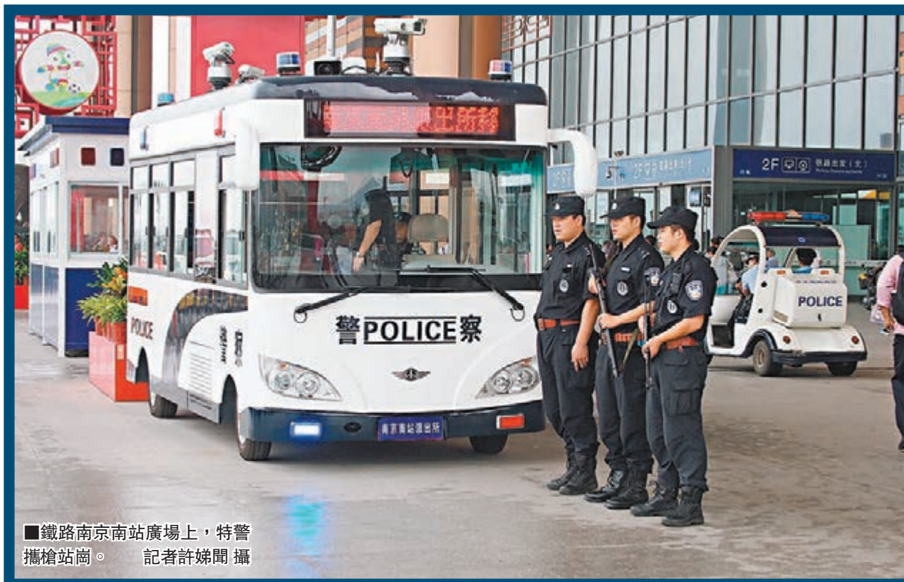
鐵路南京南站廣場上,特警攜槍站崗。

火車站之外,人流量同樣密集的南京地鐵則是逢包必查——所有乘客的挎包和袋裝物品都必須接受X光通道機檢查,安檢儀器旁,兩名警察加兩名武警成為標配。較小的夾包和挎包也必須接受手持檢測儀器的檢查。升級的安檢也讓早上高峰期間出現了