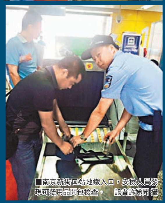
南京新街口地鐵入口,安檢人員發現可疑用品開包檢查。