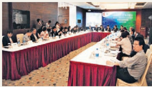
內蒙古(香港)經貿文化活動媒體見面會現場。

香港文匯報訊(記者 楊茂軍、郭燕 香港報道)「同心圓夢·美麗中國」之內蒙古(香港)經貿文化活動暨中國民族貿易會香港分會掛牌儀式將於今日舉行。內蒙古將在本次活動上進行豐富多彩的系列文化經濟推介活動,當中包括包括內蒙古民族藝術、旅遊文化、經濟項目及投資項目等一系列內容,讓香港市民和客商充分全面地了解一個文化豐富多樣,資源充足優質,經濟前景廣闊的內蒙古。