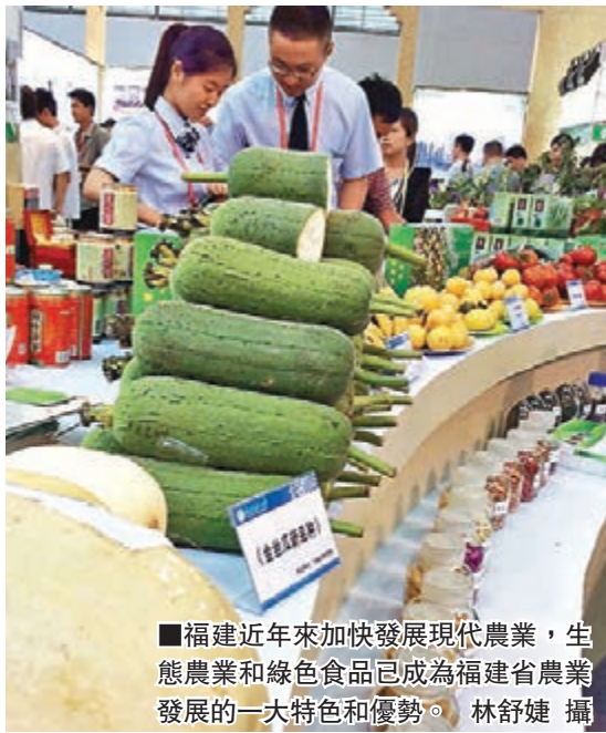
福建近年來加快發展現代農業,生態農業和綠色食品已成為福建省農業發展的一大特色和優勢。

統計數據顯示,2013年福建農產品進出口繼續保持良好增勢,全年實現農產品進出口140.5億美元,同比增13.8%。其中,出口82.3億美元,比增8.8%,形成了安溪茶葉、長樂鱈魚、福清蛋品、永春蘆柑、莆田蔬菜、寧德大黃魚、南平禽肉、東山水產品等一批在國內外具有較強市場競爭力的優質特色農產品生產集聚區。