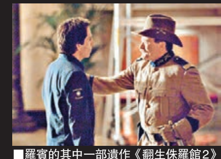
羅賓的其中一部遺作《翻生侏羅館2》中的劇照。