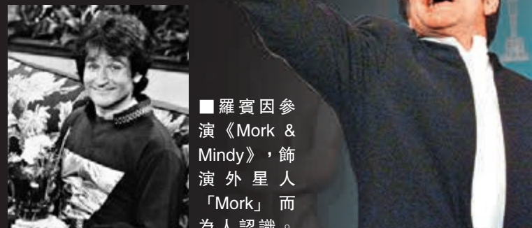
羅賓因參演《Mork & Mindy》，飾演外星人「Mork」而為人認識。