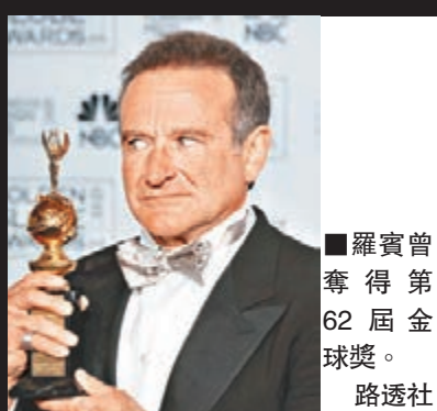
羅賓曾奪得第62屆金球獎。

終年63歲的荷里活影星羅賓威廉斯，是美國喜劇泰斗，為廣大影迷帶來不少歡樂。羅賓一生成就非凡，曾榮獲金球獎、奧斯卡、艾美獎及格林美獎，可說是荷里活的天才型演員。