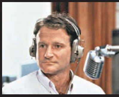
羅賓於《早安越南》的劇照。