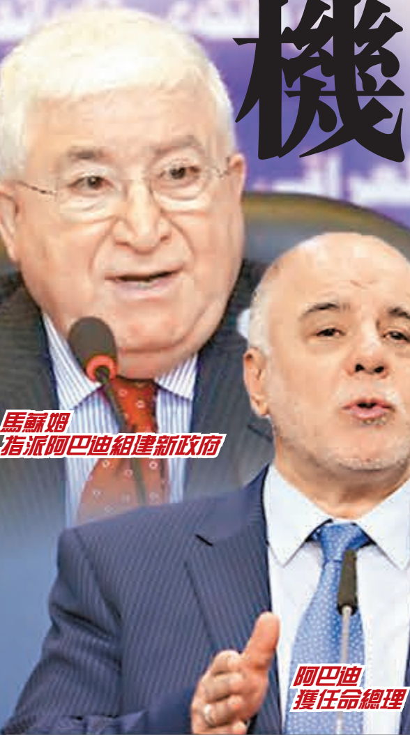
馬蘇姆指派阿巴迪組建新政府