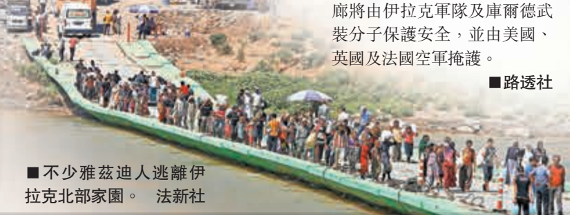
■不少雅茲迪人逃離伊拉克北部家園。