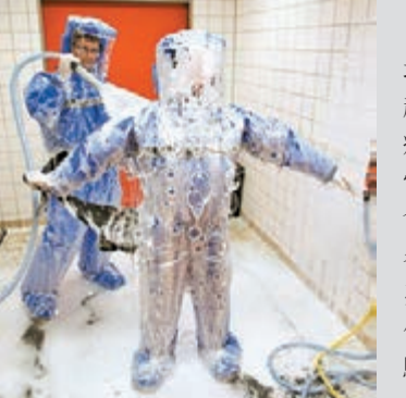
■柏林醫院示範應對伊波拉的程序。

伊波拉疫情令全球人心惶惶，各地紛紛加強檢疫措施防範，印尼和越南當局分別指示衛生部門做好防疫工作。伊波拉病毒在韓國掀起恐慌，2014年國際數學家大會明日會於首爾揭幕，主辦單位勸喻12名尼日利亞數學家不要出席大會。非洲中部國家盧旺達則出現首宗疑似病例，當局已隔離患者並進行化驗。