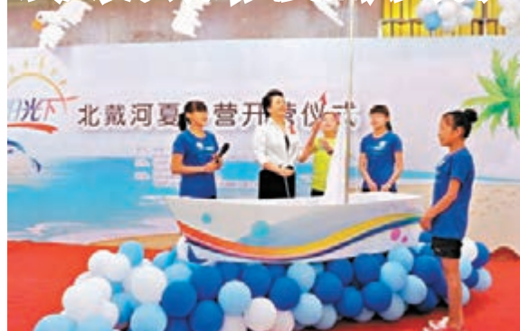
彭麗媛同孩子們一起緩緩升起風帆。網上圖片

香港文匯報訊 據《京華時報》報道,世界衛生組織愛滋病防治親善大使彭麗媛8日在北戴河出席「愛在陽光下——愛滋病致孤兒童夏令營」開幕式,並同孩子們一起緩緩升起風帆。現場播放的背景音樂,正是她演唱的抗愛滋歌曲《愛你的人》。這是她參與防治愛滋病公益事業的第9個年頭了。