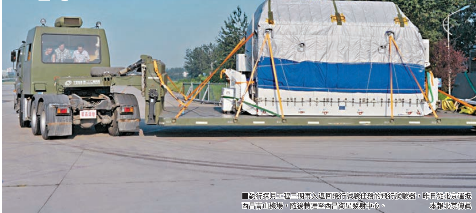
執行探月工程三期再入返回飛行試驗任務的飛行試驗器,昨日從北京運抵西昌青山機場,隨後轉運至西昌衛星發射中心。本報北京傳真

官方消息顯示,執行再入返回任務的飛行試驗器昨日已從北京運抵西昌青山機場,隨後轉運至西昌衛星發射中心。這意味著,試驗已經進入最後準備階段。在運載火箭入場、系統測試、合練等步驟完成後,任務發射即將進入倒計時。