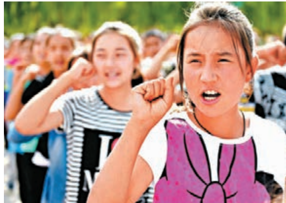
新疆阿瓦提縣萬名群眾及宗教人士近日集體宣誓,誓與暴力恐怖行為勢不兩立。

據官方媒體報道,7月28日發生在莎車縣的嚴重暴力恐怖案共造成無辜群眾37人死,13人傷。警方在處置過程中,擊斃暴徒59人,拘捕215人,繳獲「聖戰」旗幟以及大刀、斧頭等作案工具。