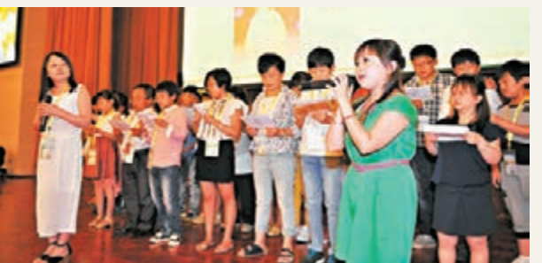
中國矮小患者代表感恩獻唱《我是一隻小小鳥》。

為此,健康時報社攜手中國下一代教育基金會、中國疾病預防控制中心婦幼保健中心、中華醫學會兒科科學分會內分泌遺傳代謝學組聯合發起「中國兒童生長發育健康日」倡導,呼籲將每年8月18日設立為「中國兒童生長發育健康教育日」,旨在喚起全社會對矮小症等兒童生長發育遲緩疾病的關注。