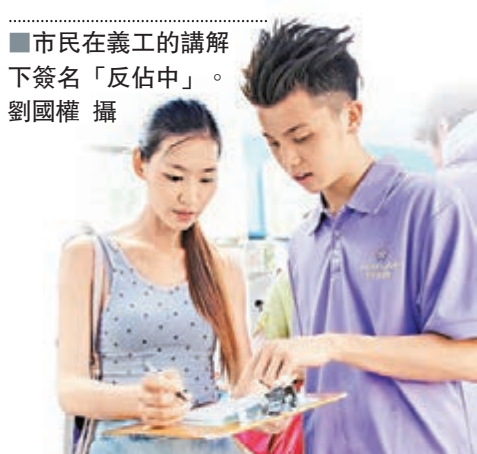
■市民在義工的講解下簽名「反佔中」。