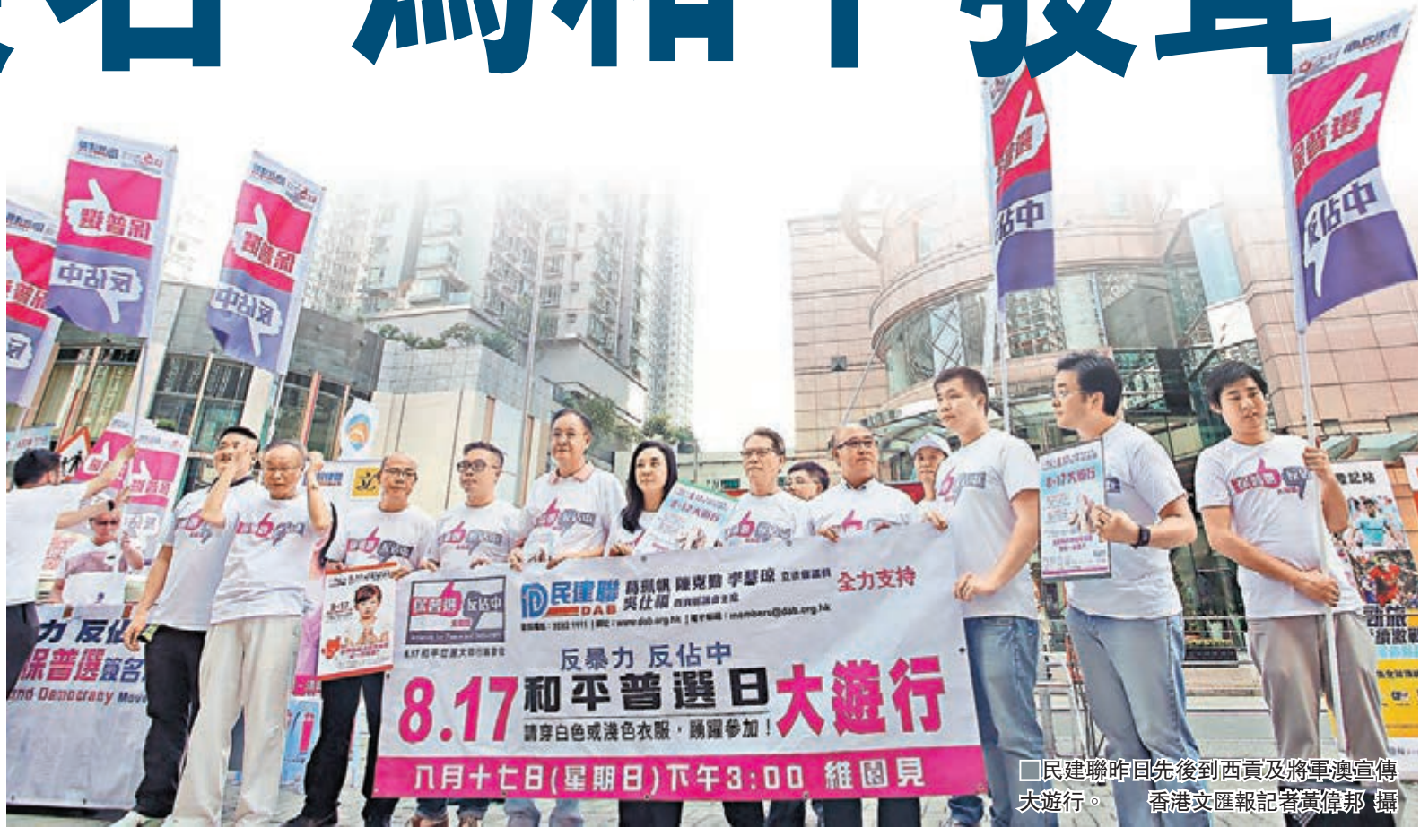
■民建聯昨日先後到西貢及將軍澳宣傳大遊行。

香港文匯報訊(記者 文森)距離「8·17和平普選大遊行」尚有一周,全城愛和平、反「佔中」的市民已摩拳擦掌,為香港繁榮穩定獻出一分力。根據「保普選 反佔中」大聯盟統計數字,開展簽名行動23天以來,簽名數目已衝破120萬大關,當中是街站收集到的簽名已接近113萬。多個團體昨日繼續落區呼籲市民響應「8·17大遊行」,其中民建聯先後到西貢及將軍澳宣傳大遊行,不少市民亦明言暴力「佔中」不能忍,誓要在8·17當天站出來,為和平、為香港未來發聲。