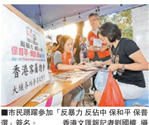
■市民踴躍參加「反暴力 反佔中 保和平 保普選」簽名。

廣東社團總會早前舉行支持「8·17和平普選大遊行」籌備工作會,主持會議的梁亮勝當時表示對遊行人數沒有預定目標,希望各個社團發動力量,為港出發聲出力。