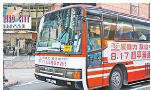
■民建聯成員與西貢區議員昨日以巴士巡遊形式呼籲市民參與大遊行。