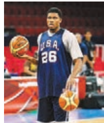
魯迪基爾曾助美國男籃贏得2010年世錦賽金牌。資料圖片

魯迪基爾歸隊後，美國男籃集訓隊的名單增加至16人。大軍將於本週四在芝加哥開始進行次階段訓練，在8月底的西班牙世界盃開始前，將會決出12人大軍名單。