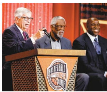
斯特恩(左)壓軸發言。

在今年2月退休的斯特恩，見證了NBA最成功的一段歷史。在1984年正式出任行政總裁開始，斯特恩將NBA球隊由23支增加至30支，着手對NBA選秀年齡進行限制，並將NBA「全球化」，提升比賽的影響力，電視收益由每年1000萬美元，激增至目前的9億美元。