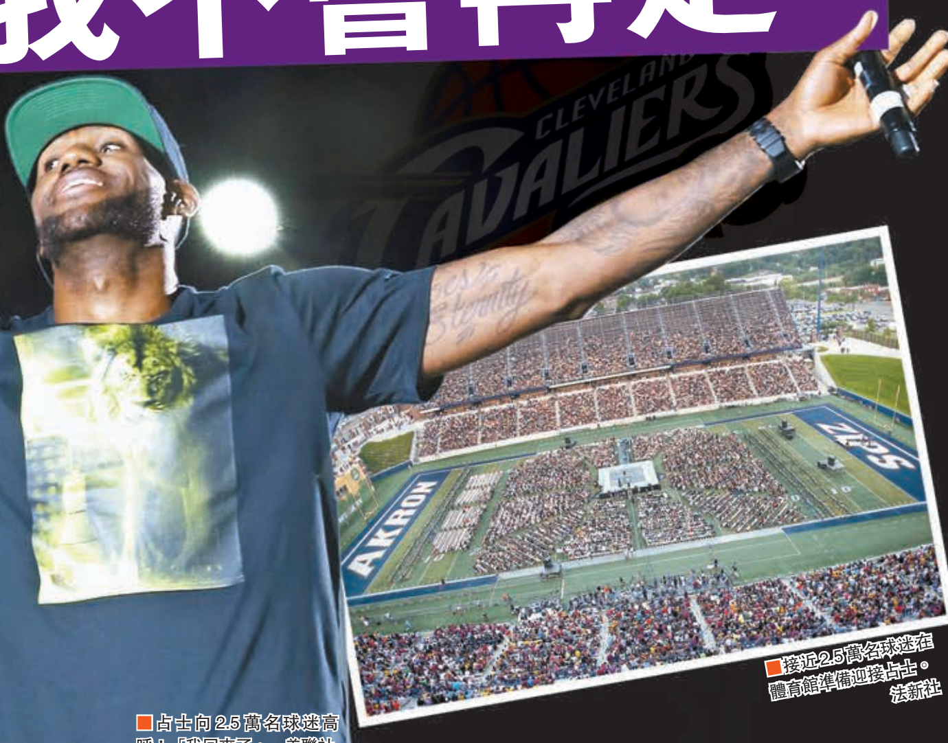
占士向2.5萬名球迷高呼：「我回來了。」