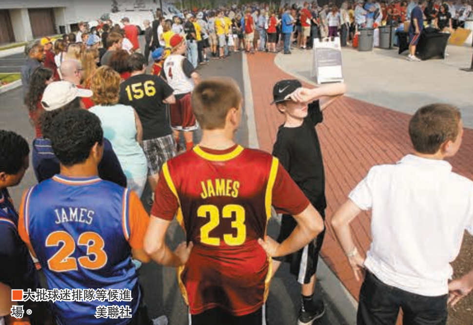
大批球迷排隊等候進場。