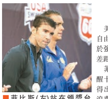
菲比斯(左)站在頒獎台上。

美國泳壇名將菲比斯的征奧之路，日前在100米自由泳得第7位而受到挫折，周五這名「飛魚」於強項100米蝶泳重拾光采，但仍以百分之一秒差距痛失冠軍。