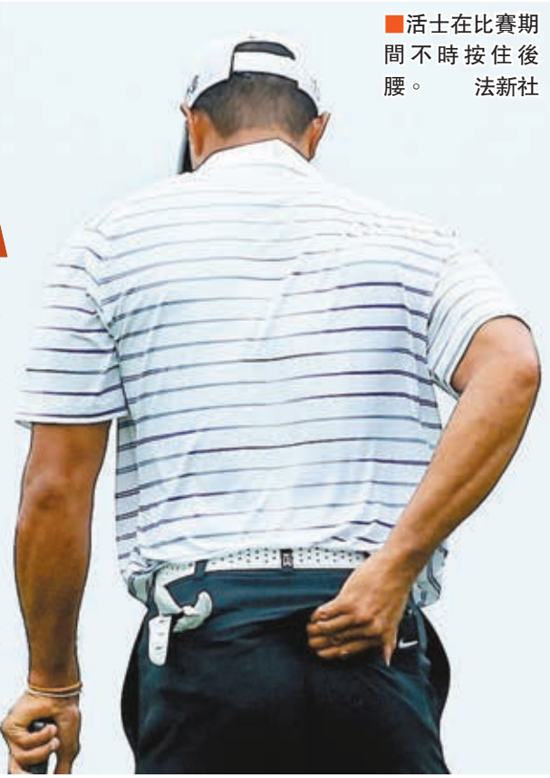
活士在比賽期間不時按住後腰。