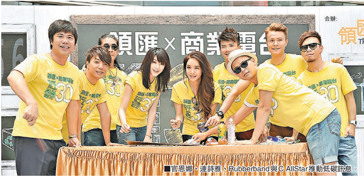
官恩娜、連詩雅、Rubberband與C AllStar推動低碳訊息。

連詩雅同樣支持低碳環保，她說：「我喜歡坐公共交通工具，尤其坐叮叮（電車）很浪漫。」問她是否與男友一起坐電車所以很浪漫，她表示每次都是一個人坐，下次會約一班朋友一起遊電車河。