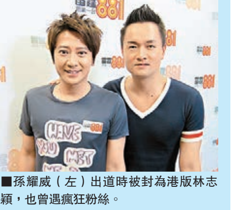
孫耀威（左）出道時被封為港版林志穎，也曾遇瘋狂粉絲。

『私奔』去。開完會後，我們兩個去了飲酒，飲醉了更在新宿街頭馬路中心相擁大哭！對於這件事，我認為是後悔不了的，但有些遺憾，因為其實這一切可以更好玩，只是對不起日本粉絲。」另外，近日有傳孫耀威與陳美詩好事近，問他陳美詩是否其終身伴侶時，老孫孫到爆的說：「絕對係！她跟我思想價值觀相近，是溝通到，我找不到任何原因要找另一個女子！（結婚計劃？）結婚是anytime都可以。我們二人有默契有自己的家庭和小孩，只是這幾年有太多工作，沒閒情逸致做這件事。我們的心態是只要一天還生得出孩子都不算遲。」