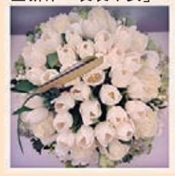
■Whim Floral Therapy Collection