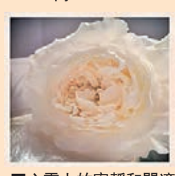
■心靈上的寧靜和閒適