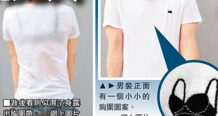
背後看則似濕了身露出胸圍帶。