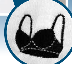
男裝正面有一個小小的胸圍圖案。

想玩「濕身誘惑」，其實毋需真的濕身。日本服飾零售商Village Vanguard趁炎炎夏日，推出兩件別出心裁的「濕身T恤」。女裝一款印上游泳後或大汗淋漓後的圖案，形成內衣黏着上衣的透視錯覺。另一款男裝T恤則會「露出」胸圍背帶，瘦削的男士穿了，隨時叫背後途人分不清是男是女。