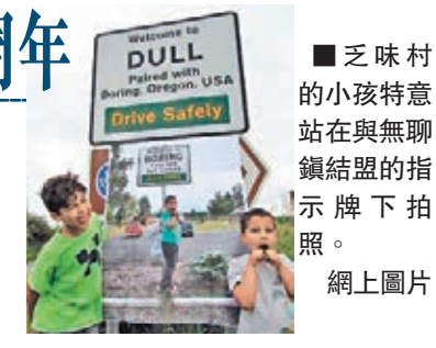
乏味村的小孩特意站在與無聊鎮結盟的指示牌下拍照。

無聊鎮真名應為「博靈」，取自19世紀一名最先在當地耕種的農夫名字；乏味村的Dull在蓋爾語的意思是「草地」，不過照字面解釋，兩者都是一個悶字。在乏味村附近居住的一名女子，兩年前踏單車經過無聊鎮，