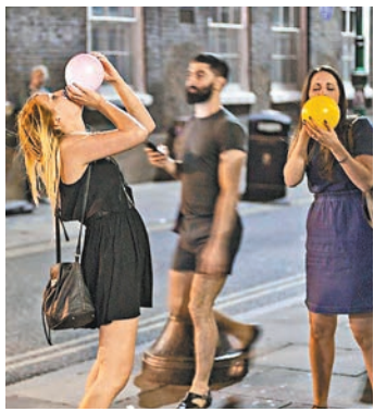
用家從氣球吸入笑氣。