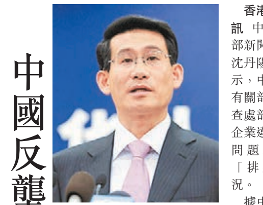
■商務部新聞發言人沈丹陽