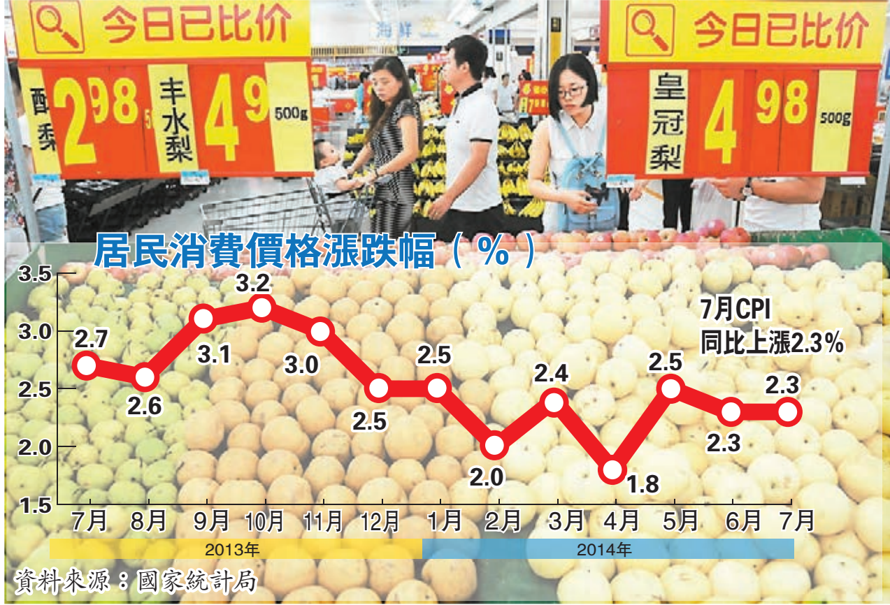
■7月份中國居民消費價格指數同比漲幅為2.3%。其中,鮮果價格上漲20.1%。圖為山西大同民眾在超市選購水果。

環比數據更能反映價格變動最新情況。7月份食品價格環比下降0.1%,非食品價格則上漲0.1%。對此,余秋梅解釋說,食品中,蛋、鮮菜、豬肉價格上漲較多,環比漲幅在0.7%至4.2%之間,但由於時令鮮果大量上市,市場供應充足,鮮果價格環比下降6.3%,致使食品類價格略有下降。同時,暑期進入旅遊旺季,部分服務