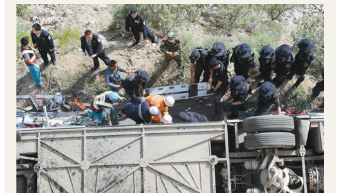
■西藏尼木縣境內發生3車連環相撞,傷亡人數未明。新華社

香港文匯報訊 昨日16時25分許,西藏尼木縣境內發生一起汽車連環相撞事故,一輛旅遊大巴、一輛越野車、一輛皮卡貨車連環相撞,初步檢查車內有40餘人。事故傷亡人數正在統計之中。