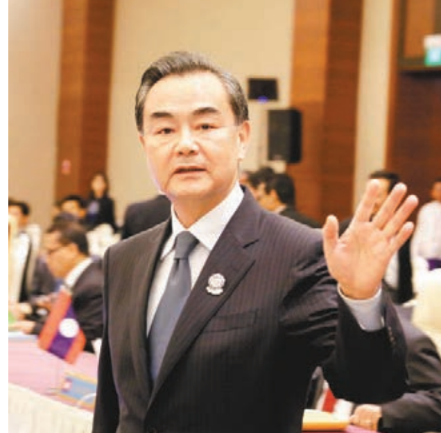
■王毅昨日在緬甸內比都出席中國—東盟外交部長會議。

王毅表示,中方願意傾聽各方對南海問題提出的善意倡議,但這些倡議應當是客觀、公正和建設性的,而不是製造新的麻煩和分歧,甚至另有所圖。如果有關倡議是為了防止局勢進一步複雜化、擴大化,則沒有必要,因為這在《南海各方行為宣言》中已有明確規定。如果有關倡議是為了另起爐灶,另搞一套,那麼勢必會干擾《宣言》的落實和《南海各方行為準則》的磋商,損害中國與東盟國家的共同利益。如果有關倡議是要搞雙重標準,那更是不公平的,也是不可能被接受的。