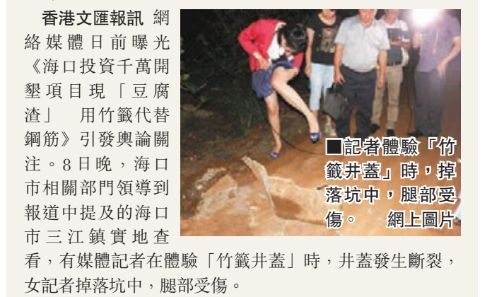
■記者體驗「竹籤井蓋」時,掉落坑中,腿部受傷。

香港文匯報訊 網絡媒體日前曝光《海口投資千萬開墾項目現「豆腐渣」用竹籤代鋼筋》引發輿論關注。8日晚,海口市相關部門領導到報道中提及的海口市三江鎮實地查看,有媒體記者在體驗「竹籤井蓋」時,井蓋發生斷裂,女記者掉落坑中,腿部受傷。