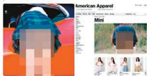
雖說是廣告照，但極度意淫，難免會惹起不滿。

美國連鎖服飾品牌 American Apparel，前日在社交網站 Instagram 刊登一張女模特兒背向鏡頭彎腰、露出內褲及臀部的照片。網民怒斥照片助長兒童色情及強姦，公司後來雖移除照片，但未有回應。