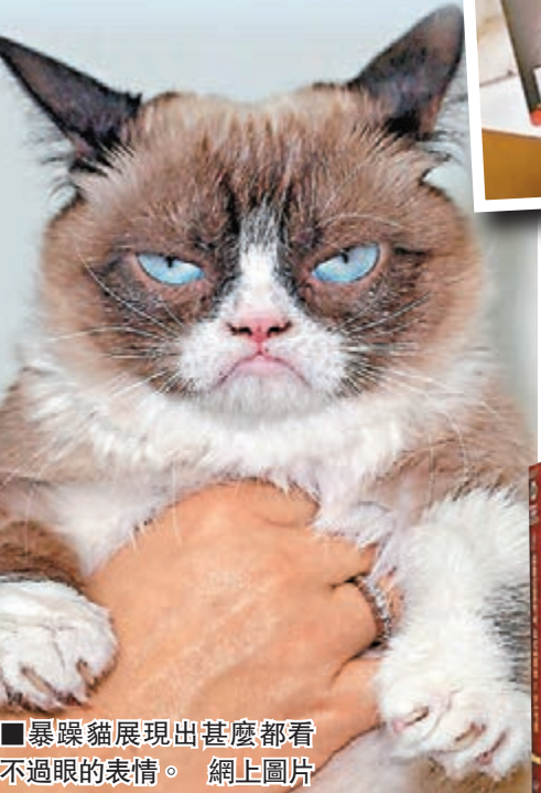
暴躁貓展現出甚麼都看不過眼的表情。

出書、拍廣告、拍電影……這不是藝人，而是一隻憑其惡相在網絡爆紅的暴躁貓(Grumpy Cat)。