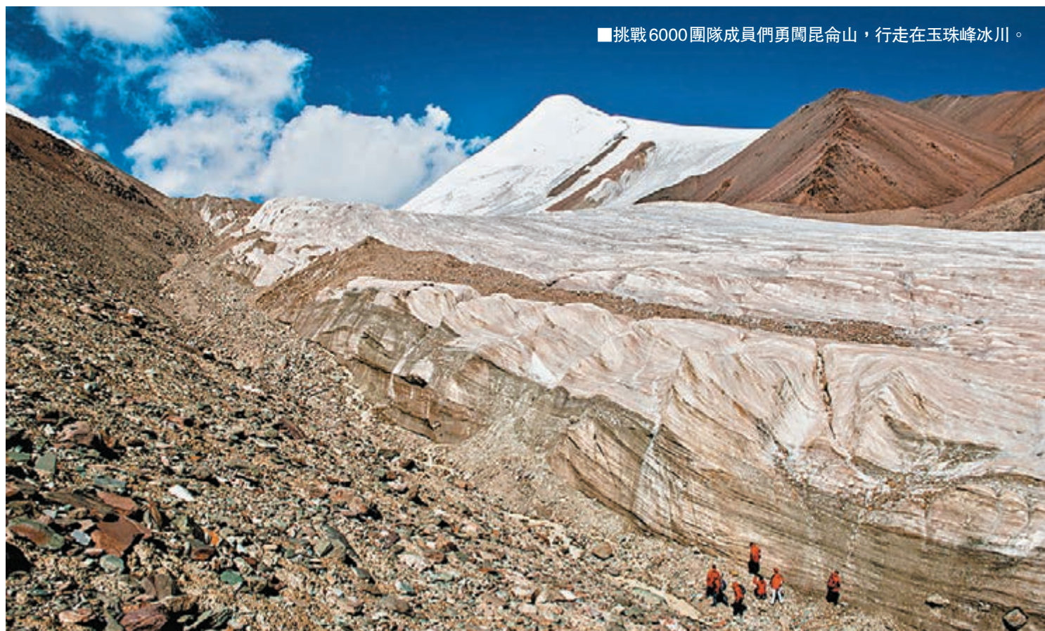
■挑戰6000團隊成員們勇闖昆侖山，行走在玉珠峰冰川。

珍稀水源地造就了雪山礦泉水的健康品質，已經讓昆侖山連續兩年蟬聯高端水市場第一品牌。伴隨大眾健康飲水意識的提升，作為國內雪山礦泉水品類的創領者，昆侖山無疑將引領國內的健康飲水的消費新風潮。