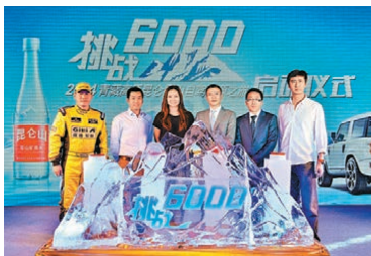
■今年4月份舉行的挑戰6,000啟動儀式新聞發布會上，兩屆大滿貫冠軍李娜現身北京，分享了去年親身挑戰的經歷，並邀請消費者探秘昆侖雪山。

今年的昆侖山自駕尋源活動，還邀請到了兩位明星——奧運冠軍陳一冰和安以軒參與見證。陳一冰現身發車儀式，並伴隨車隊體驗了西寧—塔爾寺—青海湖段的旅程；安以軒則與專業車手隊長黃威志一