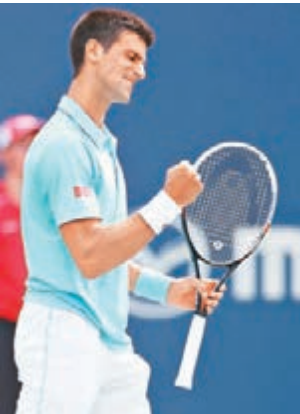
祖高域險勝蒙菲斯。

多倫多網球大師賽周三繼續進行,男單世界第一的塞爾維亞球手祖高域,經過3盤苦戰險勝法國名將蒙菲斯,落敗的蒙菲斯則給全場比賽帶來不少歡樂。