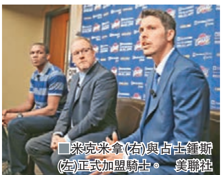
米克米拿(右)與占士鍾斯(左)正式加盟騎士。