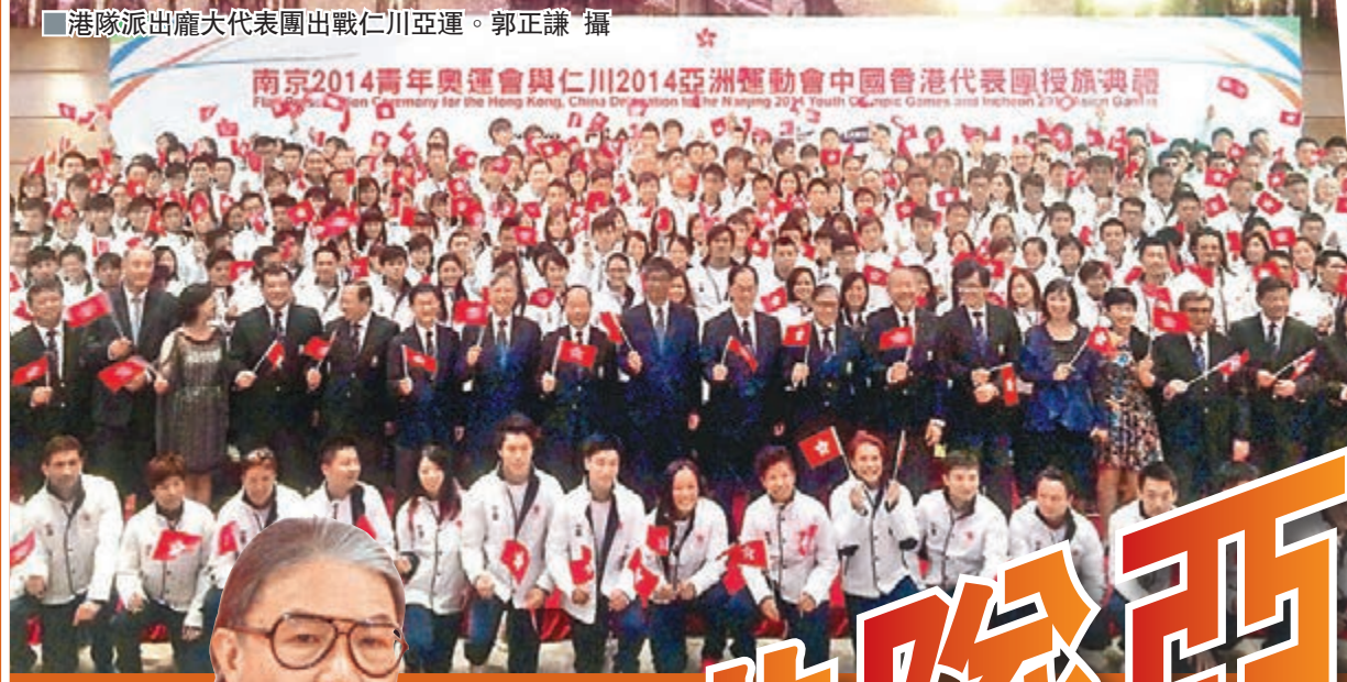
港隊派出龐大代表團出戰仁川亞運。