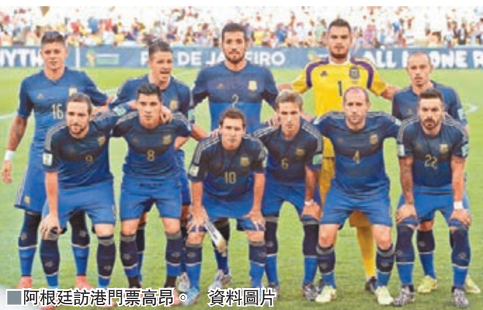
阿根廷訪港門票高昂。資料圖片

香港文匯報訊(記者 梁啟剛)2014年世界盃亞軍阿根廷國家隊將於10月14日假香港大球場與香港代表隊踢表演賽,作為香港足球總會百年慶典的壓軸活動。足總昨日公布球迷最關心的門票價錢,成人票價共分5種(港元計),最貴為1800元,其餘的包括1300元、850元、590元及490元,學生及長者特惠票則為250元,而當中超過5成的門票價格是低於600元以下。門票可於本月21日起透過 Cityline 購票網站 www.cityline.com 或熱線電話 2111-5333 購買,球迷亦可親身前往通利琴行購票。