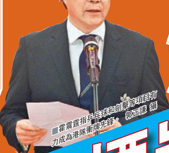
霍震霆指乒乓球和劍擊等項目有潛力成為港隊衝牌先鋒。