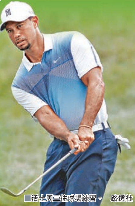
活士周三往球場練習。