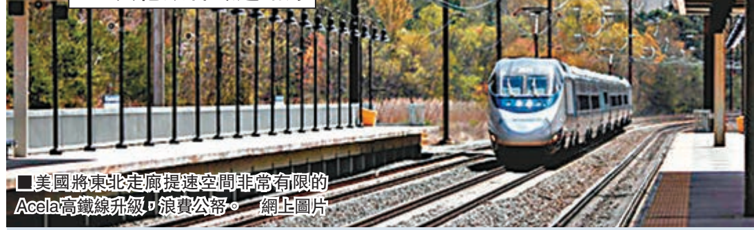
美國將東北走廊提速空間非常有限的Accla高鐵線升級，浪費公帑。