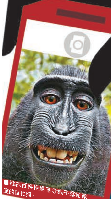
猴子還拍下攝影師斯萊特。 網上圖片

另外，強颶風「夏浪」昨日集結於日本沖繩以西海域，預料明日吹襲九州南部，為鹿兒島一帶帶來狂風暴雨及巨浪。 ■路透社/美聯社/法新社