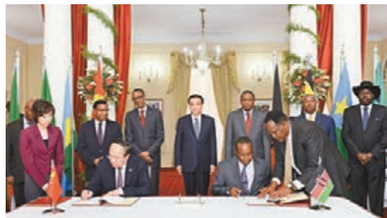
今年5月11日，李克強總理與肯尼亞總統肯雅塔共同見證了蒙內鐵路合作協議的簽署。資料圖片

香港文匯報訊 據肯尼亞商業日報網報道，至少5000名中國工人抵達肯尼亞，參加該國的鐵路建設項目。這些中國工人將同三萬名當地工人一道受僱參與今年10月開工的蒙內鐵路項目。