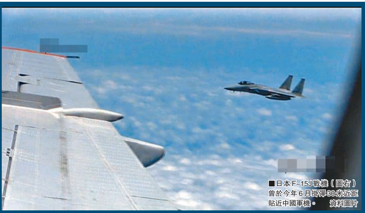
日本F-15J戰機(圖右)曾於今年6月掛彈30米近距離貼近中國軍機。資料圖片

採取相對克制行動，比如語音警告、伴飛等措施，不希望事態擴大，積極維護東海和平穩定，但日本方面不排除會採取發射曳光彈，甚至實彈警告射擊等主動行動，一旦出現誤判，就可能引起擦槍走火。他稱，若日本挑釁中方底線，中方亦會後發制人，奮起反擊，採取果斷措施。