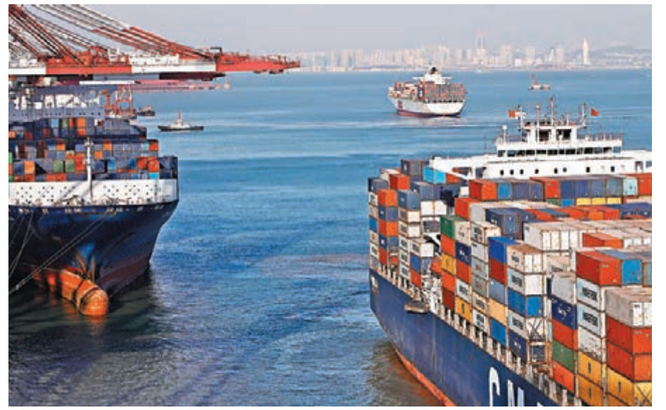
中國7月製造業指數(PMI)上升至51.7，連續五個月回升，反映經濟動力增強。在2013年，中國已成為世界第一貨物貿易大國，圖為繁忙的青島港集裝箱碼頭一角。

比如佔近三個月榜首的紐約銀行美倫環球新興市場投資基金，主要是透過新興市場國家的公司證券管理組合，以實現長期資本增長的投資策略目標。該基金在2011、2012和2013年表現分別為-25.53%、13%及-6.46%。基金平均市盈率、標準差與近三年的貝他值為9.61倍、22.21%及1.19倍。