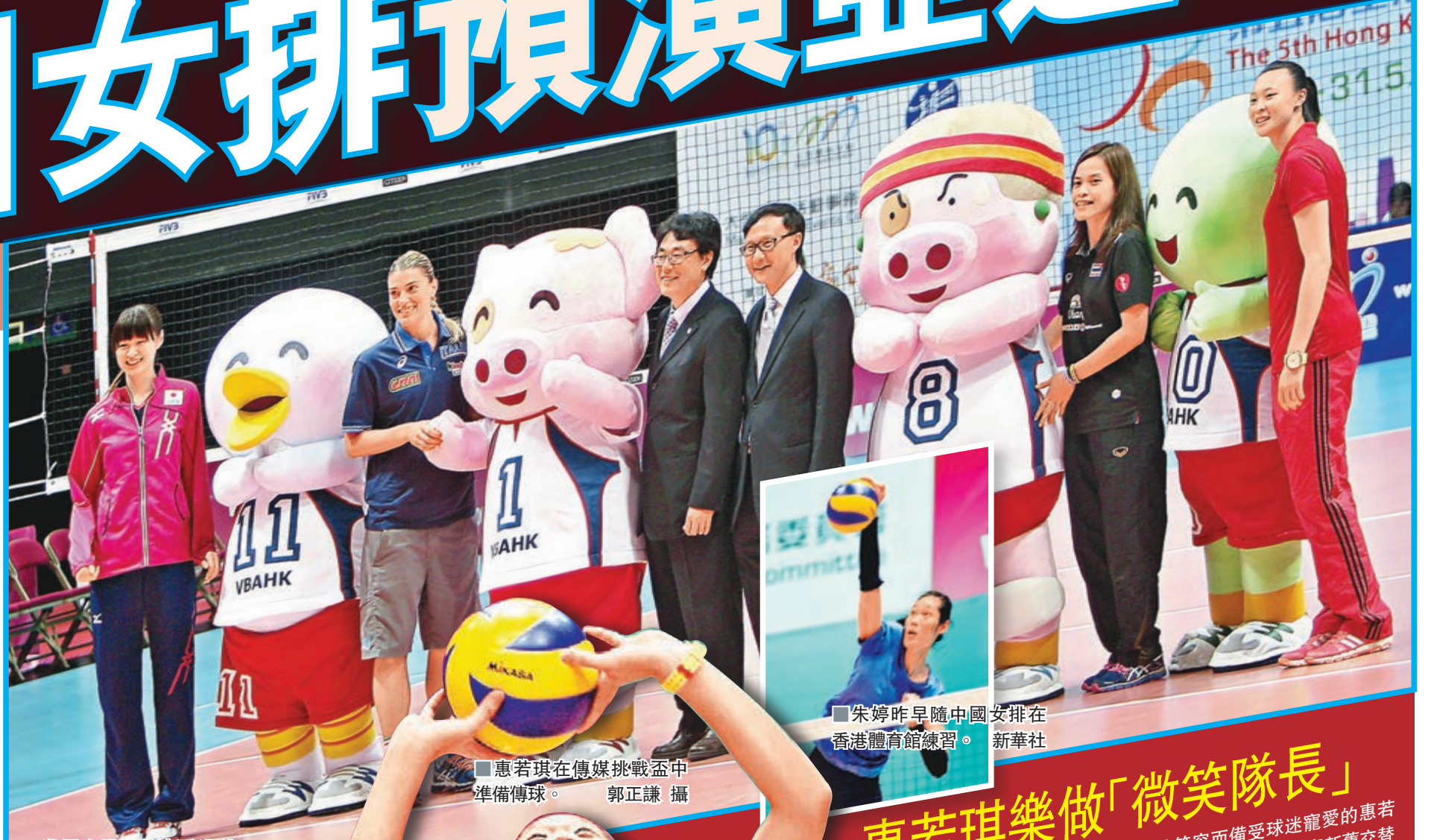
世界女排大獎賽香港站賽事明日揭幕。

日本在上一站賽事錄得3連敗,不過球隊每對中國女排均有超水準演出,而泰國就是近年進步神速的「黑馬」,上周爆冷擊敗上屆季軍塞爾維亞,表現更令人眼