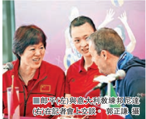
郎平(左)與意大利教練邦尼達(右)在記者會上交談。

香港文匯報訊(記者郭正謙)世界女排大獎賽香港站將於8月8日起一連三日假香港體育館舉行,今屆賽事除繼續有備受本地球迷愛戴的中國女排及歐洲勁旅意大利外,更有日本及泰國2支亞洲強隊,對矢志衝擊亞運金牌的中國女排而言,儼如一次重要的亞運預演。