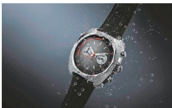
■計時碼錶設計以復刻 LONGINES 於 70 年代專為潛水而設的腕錶作藍本。腕錶內藏 L651.3 機芯，備時、分、秒顯示，60 秒及 30 分鐘累計錶盤分別設於 3 時及 9 時位置，日期顯示窗則設於 6 時位置，配以黑色拋光緞面打磨錶面。