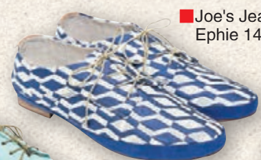
■Joe's Jeans Ephie 1480 hypnotic