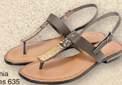
■Cromia Shoes 635