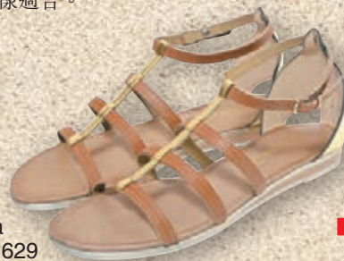
■Cromia Shoes 629