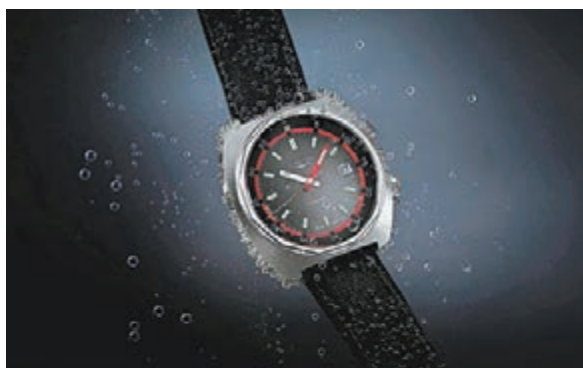
■3針設計以復刻 LONGINES 於 70 年代專為潛水而設的腕錶作藍本。腕錶內藏 L633.5 機芯，備時、分、秒顯示，日期顯示窗設於 3 時位置，配以黑色拋光緞面打磨錶面。

備有 3 針的型號特意運用大膽色調與黑色錶面造成和諧對比，包括紅色指針、紅色分鐘顯示、Super-LumiNova® 夜光塗層及灰色錶鏡。顯示刻度由 0 至 60，將分針調校至 12 時顯示進行同步，可讓潛水員簡易計算停留在水底的時間，位於 2 時位置的錶冠用作調校內錶圈之用。另一款計時碼錶採用相同色調設計，顯示刻度則由 60 至 0，將設定的時間點與分針同步，可讓潛水員簡易計算剩餘的時間，以便返回水面時預算足夠時間減壓。全新 The Longines Heritage Diver 經典潛水腕錶配備黑色合成纖維或橡膠錶帶。