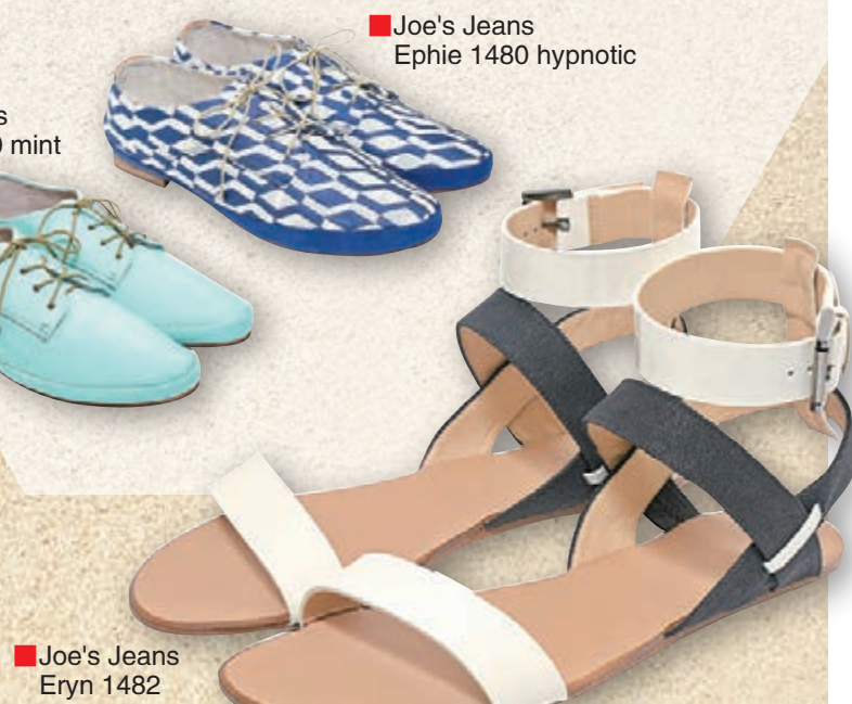
■Joe's Jeans Eryn 1482