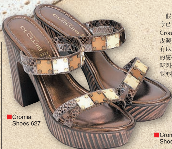
■Cromia Shoes 627