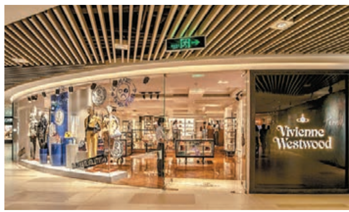
■全球最大的 Vivienne Westwood 店現已於上海 K11 隆重開幕。

為了讓客人進入每個區域也能感受到不同的氣氛，英國的設計師團隊刻意在地板的選材上下功夫。店內不同區域用上了色澤溫暖的人字拼花木地板、風車拼花木地板以及紋理分明的米色雲石，氣派盎然，不落俗套。當中風車拼花木地板更是為了 Gold Label 範圍特別設計，令店內部裝潢顯得層層有致，吸引客人走遍全店參觀。此外，每個區域亦設有座椅與茶几，貴氣的 Royal blue 絲絨襯上古典優雅的木雕，讓客人在稍事休息的時候亦能感受到淡淡的英倫氣息。此外，店內亦特設寬敞的 Gold Label 試身室，即使試穿一套下擺寬大的晚裝甚至婚紗，亦有偌大的空間讓客人細看身上的設計。整間店裝修比現有任何一間分店更細膩雅緻，配合華麗而不落俗套的傢俱陳設，絕對是 Vivienne Westwood 愛好者必到的朝聖點！