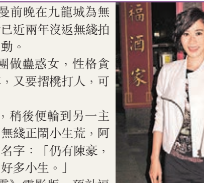
阿佘在新劇中扮演臥底做蠱惑女。

稍後阿佘會前赴英國拍攝《衝上雲霄》電影版,預計逗留一個月,所以接不到其他劇,有指她賺少很多,阿佘不介意說:「沒關係,只求質素。」