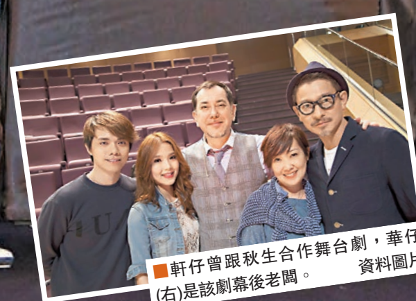
軒仔曾跟秋生合作舞台劇，華仔(右)是該劇幕後老闆。