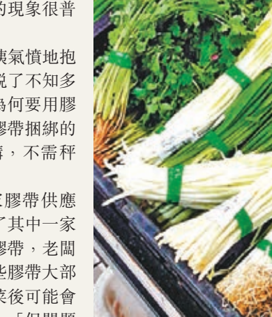
用工業膠帶捆綁蔬菜存在安全隱患。

墨玉鎮等9個鄉鎮數萬名群眾自發拿起棍棒參與到清查圍捕行動中，對警方確定的3個重點區域展開網式清查。在得知消息的關依其鄉一