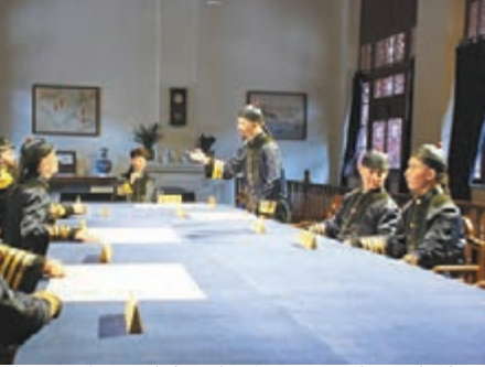
■北洋海軍提督署議事廳蠟像。

香港文匯報訊(記者 于永傑 山東報導)甲午海戰爆發120周年之際,經過4年多的修復復原,當年北洋海軍的指揮機關——北洋海軍提督署,日前在威海劉公島正式開館,提督署16個廳室全部對外開放。據劉公島管委會副主任周德剛介紹,這是現在國內或者世界上唯一一處原汁原味展現北洋海軍辦公指揮的場所。 整個北洋海軍提督署分為前、中、後三進院落共16個廳室,每個廳室都按照其原有功能進行原貌復原,共仿製傢具300多件,復原歷史塑像18座,各類文物200多件,瓷器、槍械等輔助展品1500多件,真實地再現了北洋海軍的組織架構和運作模式。提督署議事廳上,一組蠟像展現了1891年初,將領為迎接李鴻章檢閱北洋海軍而在討論相關方案的歷史。