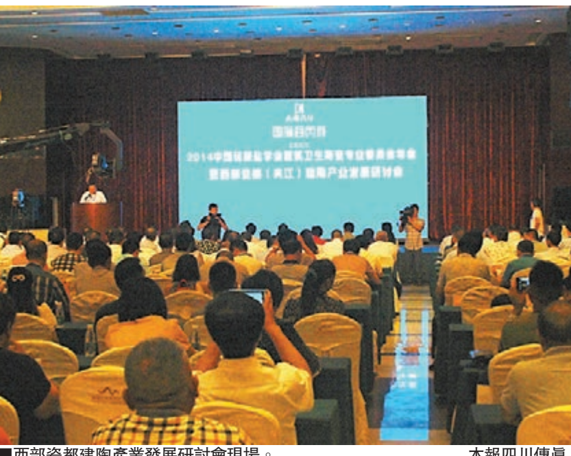
■西部瓷都建陶產業發展研討會現場。

香港文匯報訊(記者 李兵 樂山報導)2014年中國硅酸鹽學會陶瓷分會建築衛生陶瓷專業委員會年會暨西部瓷都建陶產業發展研討會日前在四川省樂山市夾江縣隆重舉行,來自內地各省市的業內專家及企業家代表共計400餘人參與會議。專家認真研究建陶產業發展趨勢,助夾江陶瓷轉型升級,成效顯著。