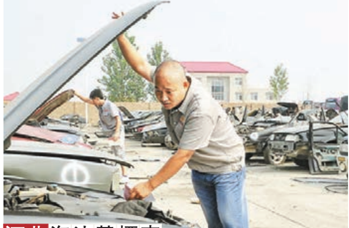
河北淘汰黃標車 河北省治理淘汰黃標車領導小組辦公室透露消息,今年上半年,河北省淘汰黃標車14.6萬輛,完成全年任務的54.59%。圖為河北滄州市一報廢車回收點的工作人員在勘驗回收的報廢車輛。

香港文匯報訊(實習記者 圖們 內蒙古報導)內蒙古經濟和信息化委員會日前發佈信息,上半年全區新開、復工億元工業項目1028項,共計投資2,150.71億元,佔內蒙古工業固定投資總額58.4%。記者獲悉,1至6月份,全區億元以上新建工業項目開工479項,完成投資額836億元,開工率100%,高出去年同期14個百分點;億元以上續建工業項目復工549項,完成投資額1,314.71億元,復工率88%。