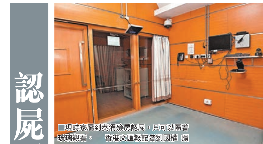
現時家屬到葵涌殮房認屍,只可以隔着玻璃觀看。