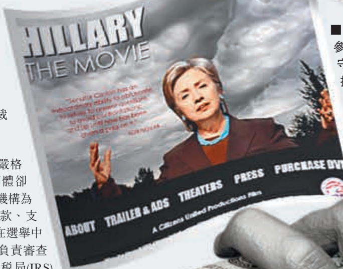
希拉里2008年參選總統時遭保守派製作紀錄片抹黑，原本遭禁播，後來判決遭推翻，企業也獲准不受金額限制地宣傳反對或支持某一候選人。