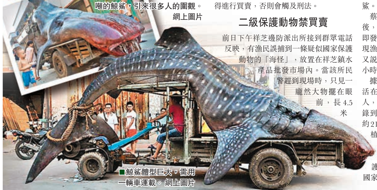
鯨鯊體型巨大，需用一輛車運載。網上圖片

福建石獅祥芝水產品批發市場裡，一條體長約4.5米、重約2噸的鯨鯊，引來很多人的圍觀。網上圖片