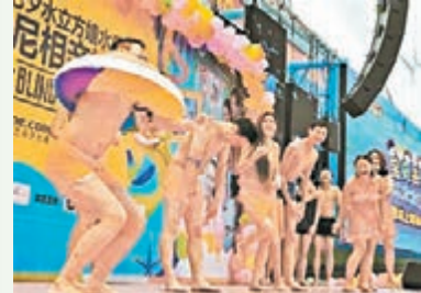
參加相親活動的單身男女穿着「清涼」。網上圖片

本月2日，北京水立方嬉水樂園有200多名單身男女前來參加相親活動。這次相親活動，要求前來的單身人士「清涼」出場，男士清一色短褲，女士則穿比堅尼。