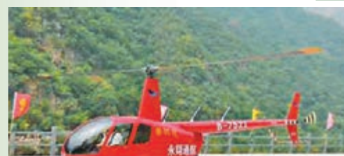
「春江號」直升機試飛。

本月1日上午，隨著「春江號」旅遊直升機在河南新鄉輝縣寶泉旅遊度假區試飛，標誌著河南省旅遊區首次引進國外直升機服務景區。