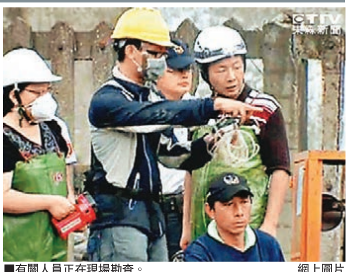
有關人員正在現場勘查。

高雄地檢署昨日(2日)公布李長榮化工及華運通儲備的工作日誌，直指李長榮在爆炸當天，就已發現管線壓力異常，卻要求華運繼續送料。