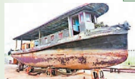
日軍侵華軍用炮艇殘骸。

一艘侵華日軍河用炮艇昨抵南京，將成為正在擴容的侵華日軍南京大屠殺紀念館新館的第一件陳列品。記者了解到，該炮艇長17.4米，寬4.2米，高3.9米，重32.8噸。今年7月4日，捐贈者曾邀請中日有關專家到儀征對炮艇進行現場考證與鑒定。經專家認真及翔實的比對後，推斷其為日本戰敗前所造炮艇。