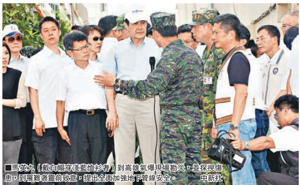
馬英九(戴白帽穿淺藍襯衫者)到高雄氣爆現場勘災，並視察傷亡，到罹難者靈前致意，提出全面加強地下管線安全。中新社

香港文匯報訊 造成28人死亡的高雄氣爆事件，至昨日為止，還有兩人下落不明，「總統」馬英九、「副總統」吳敦義連續兩日南下慰問並視察，馬英九在氣爆現場聽取軍簡報時強調，行政調查已經立刻要進入，而司法調查也開始了，調查當然是追究相關責任。此外國民黨台北市長參選人連勝文表示將以「個人名義」捐出200萬元新台幣，慰問高雄8·1氣爆事件中傷亡的警員、消防及環保人員。