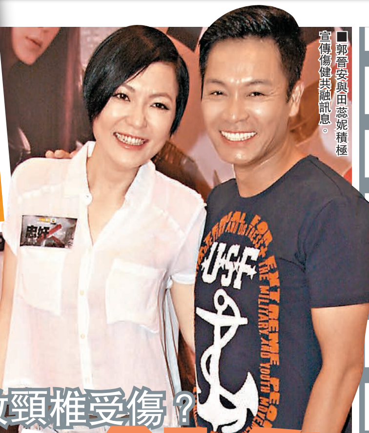
郭晉安與田蕊妮積極宣傳傷健共融訊息。