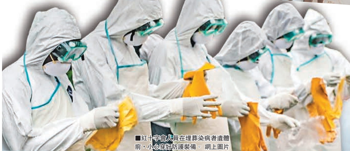
紅十字會人員在埋葬染病者遺體前，小心穿好防護裝備。

有利比里亞救援人員表示，當地民眾無視政府呼籲，自行用的士或私家車將患者送到醫院，而非致電熱線由救護車和有保護裝備人員接載病人，令病毒容易傳染他人。他們警告，伊波拉死亡人數增加的主要原因，是民眾無知。