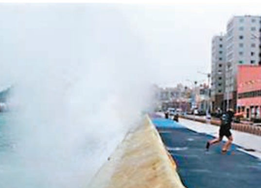
風暴令海邊湧起大浪。

熱帶風暴「娜基莉」昨日吹襲韓國南部，帶來狂風暴雨，200多班來往濟州島的航班需取消，1,600戶停電及多幢建築物遭破壞。