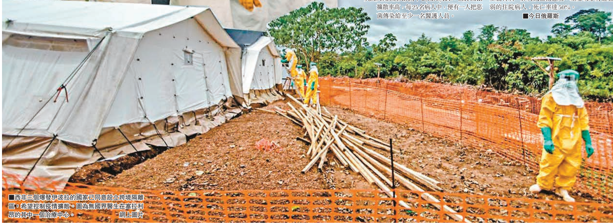
西非三個爆發伊波拉的國家已同意設立跨境隔離區，希望控制疫情擴散。圖為無國界醫生在塞拉利昂的其中一個治療中心。網上圖片