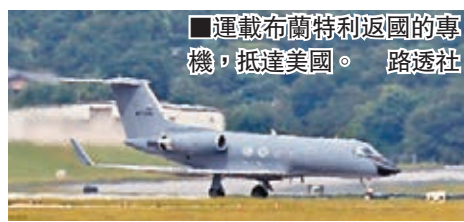
運載布蘭特利返國的專機，抵達美國。