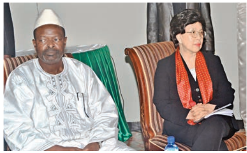
陳馮富珍與西非3國開會，討論抗疫。

3個疫國的領袖與世衛高層前日在幾內亞首都科納克里召開緊急會議，由相關國家組成的「馬諾河聯盟」秘書長道勞布表示，他們同意設立跨境隔離區，由軍警把守，防止民眾出入，而被隔離的人會獲物質支援。