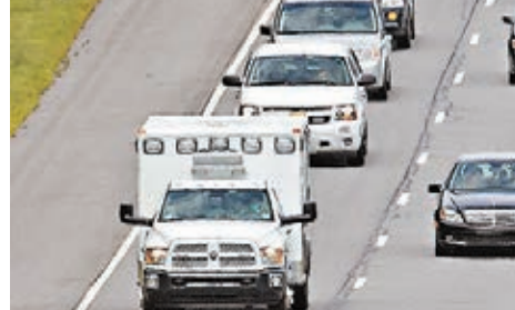
救護車離開機場，駛往醫院。

美非峰會將於本週在美國華盛頓舉行，屆時約有50個非洲國家的代表出席。美國總統奧巴馬前日表示，美方會要求代表團抵埗時接受進一步身體檢查，以防伊波拉傳入。他指這次伊波拉疫情較以往嚴重，須認真對待，相信有關措施恰當。