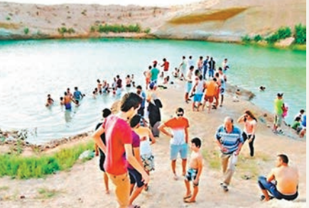
■神秘湖泊水深18至20米。 網上圖片

北非國家突尼斯一批牧民上月初在南部城市加夫薩發現一個離奇出現的湖泊，成為當地民眾在高溫下的消暑聖地。但政府警告湖泊附近是磷酸鹽礦，一直被高度開採，憂慮水源受污染，甚至有可致癌的放射性物質。