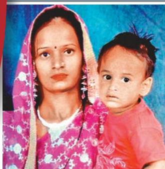
■平奇與愛兒的合照。 網上圖片

印度德里發生兒童被活生生灼死的意外。一名母親上週三抱着3歲兒子站在街上，突然有輛電動三輪車高速衝向