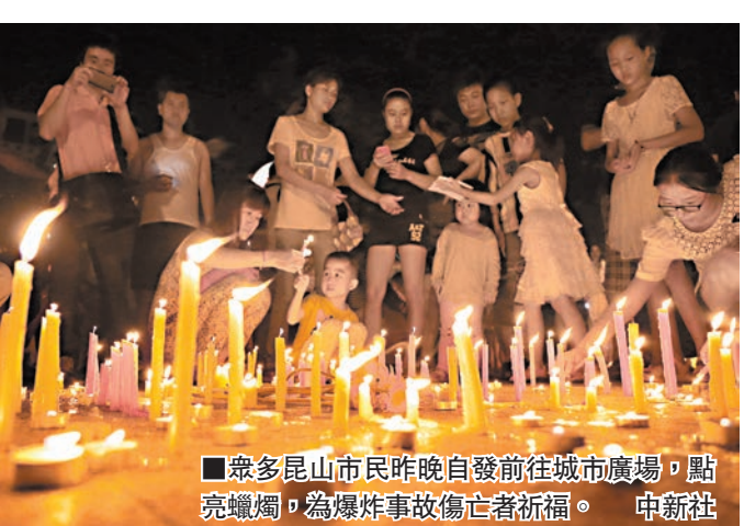
眾多昆山人昨晚自發前往城市廣場，點亮蠟燭，為爆炸事故傷亡者祈福。

事發於昨日上午7點35分，一聲巨響，昆山中榮金屬製品有限公司汽車輪轂拋光車間在生產過程中發生爆炸。