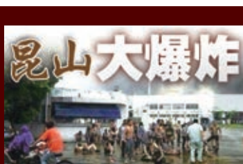
香港文匯報訊 (記者楊明奇、趙勇、彭斌、許娣聞 昆山報道) 江蘇昆山開發區

昨日一台灣金屬工廠發生嚴重爆炸事故，已造成69人遇難，191人受傷。事故原因初步判斷為粉塵濃度過大，遇明火引發爆炸。據了解，事發現場溫度高達兩、三千度，超高溫導致皮膚碳化，部分傷者皮膚燒傷面積高達95%。