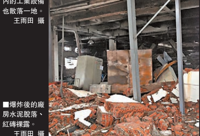
爆炸後的廠房水泥脫落，紅磚裸露。