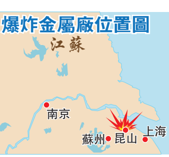
爆炸金屬廠位置圖

昆山中榮金屬製品有限公司是一家鋁合金電鍍表面處理、鋁合金電鍍加工等產品專業生產加工的企業。據昆山中榮金屬製品有限公司自網介紹，該公司有員工450人。