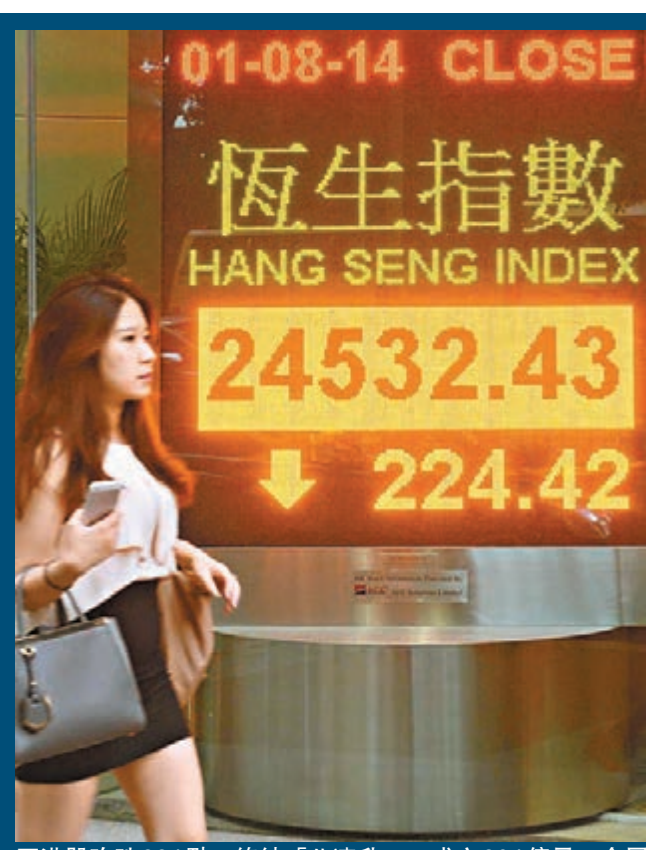
■ 港股昨跌224點，終結「八連升」，成交804億元。全周計恒指仍累升316點或1.3%。 中通社

美聯儲局稱當地經濟復甦的步伐正加快，在擔心提早加息下，地產股借勢回吐，中期業績理想的長實全日捱沽，曾跌逾5%，全日跌4.7%成表現最差藍籌；恒隆(0101)亦跌1%，信置(0083)跌1.5%，新地(0016)跌2%，新世界(0017)跌1.4%。不過，植耀輝認為美國加息還有一段時間，相信地產股只屬借勢回調，料恒指在10天線會有支持。