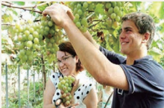
延慶葡萄園提供苗木15萬株。

2014年第十一屆世界葡萄大會讓我們相聚在北京，相約在雄偉的八達嶺長城腳下，共享延懷河谷的自然之美、生態之美、人文之美。北京延慶與河北懷來依山傍水，相連相連，是大自然母親精心勾畫出來的一處壯美河谷，他們如一對雙胞兄弟，蹦蹦跳跳玩要在燕山大地，帶着生機，充滿活力。特別值得一提的是，北京延慶與河北懷來兩地以世葡會舉辦為契機，加強旅遊合作，整合兩地旅遊、文化、葡萄資源，推出了以「延懷河谷」為主題的五條世葡會精品旅遊線路，線路涵蓋延慶的野鴨湖國家濕地公園、松山森林旅遊區、古崖居、北京龍灣國際露營公園、世界葡萄博覽園等知名景區，以及懷來的瑞雲酒莊、紫晶莊園、桑幹酒莊、天漢景區、帝皇溫泉等特色旅遊資源，無論您是在北京還是在河北，一次選擇就可以遊遍兩地最具特色的旅遊資源。（北京報道）