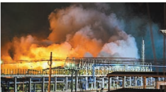
發生火災的江蘇燕進石化公司。

位於江蘇省常州市新北區羅溪鎮的江蘇燕進石化有限公司桶裝庫，於7月31日18時左右發生火災。發生火災事故的倉庫面積約2,000多平方米，儲存的主要是羥乙酯、羥丙酯、醋酸甲酯、氧化劑、立邦漆、四氫呋喃、丁醇、間苯二胺等桶裝產品。目前，常州當地環保部門在現場進行的監測表明，周邊水體沒檢出火災相關污染物質。