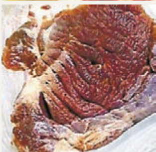
涉事檔口售賣的問題「牛肉」。

香港文匯報訊 據《新快報》報道，賣12元一斤的「牛肉」，經水洗後變得灰白。近日，有廣州市民投訴，在芳村中市社區一帶，有檔主大量出售這類問題肉，疑為染色肉。這些「牛肉」水洗後除了顏色發白，肉質還變軟發散。