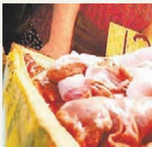
檔主稱，這些「牛肉」12元一斤。當執法檢查時，她又稱是豬肉。