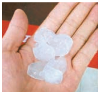
有網民貼出捧着冰雹的照片。

香港文匯報訊 據深圳新聞網報道，深圳市氣象局透露，這次是深圳有史以來第一個冰雹分區預警。據氣象部門觀測數據顯示，8月1日，深圳市高溫酷熱天氣持續，全市大部分地區記錄到35℃以上的最高氣溫，有29個自動氣象站最高氣溫達到37℃以上。當日下午在強熱帶風暴「娜基莉」外圍環流和環境場之間激發起的局地強對流雲團給深圳和東莞帶來雷雨、大風和冰雹。