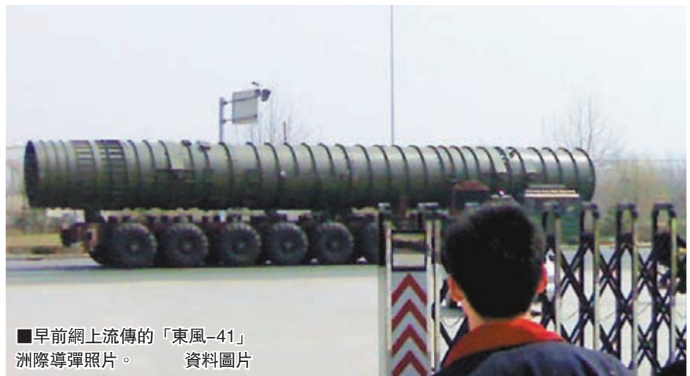
早前網上流傳的「東風-41」洲際導彈照片。

《環球時報》曾報道說，東風-41可輕易在河南攻擊美國更廣闊的中部地區，若部署到大陸東北，射程可涵蓋美國本土全部範圍。