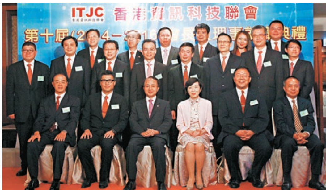
香港資訊科技聯會就職禮上，主禮嘉賓和理事會成員合照。

務更上一層樓。」他續說，自己上任7年來，為推動兩地IT合作，組織承辦、協辦了300個活動，其中值得一提的是2007年與深圳科協組織的「深港科技團體聯盟」，以及到目前為止運作了3年的「深港青年創意大賽」，這些活動和平台不僅給年輕人提供一展所長的機