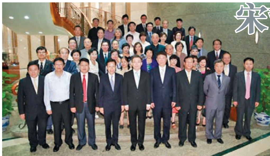
外交部駐港特派員宋哲與港島區議員舉行午餐會。

香港文匯報訊 據外交部駐港特派員公署網站載，外交部駐港特派員宋哲於8月1日為港島區議員舉行午餐會，來自中西區、東區、南區和灣仔區的區議會主席、副主席和區議員50餘人出席。 宋哲向來賓介紹了內地經濟發展的新情況，指出上半年經濟運行保持在合理區間，主要指標符合年度預期，經濟運行保持平穩，改革開放活力增強，發展質量穩步提升，民生保障扎實有力。 他說，中國經濟頂住壓力，開局良好；保持定力，成效顯著；增強動力，前景光明。中國仍處在發展的重要戰略機遇期，轉型升級階段的中國經濟正在積蓄新