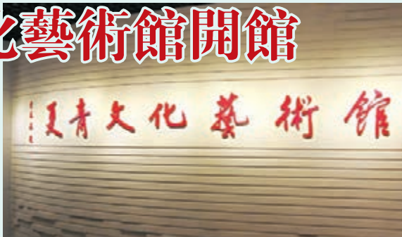
■夏青文化藝術館館名，李嵐清題寫。

該館使用面積420多平方米，由李嵐清題寫館名。記者在參觀時發現，館內在多處配置了儲存着夏青播音作品的觸屏電腦、耳機供參觀者隨時欣賞。