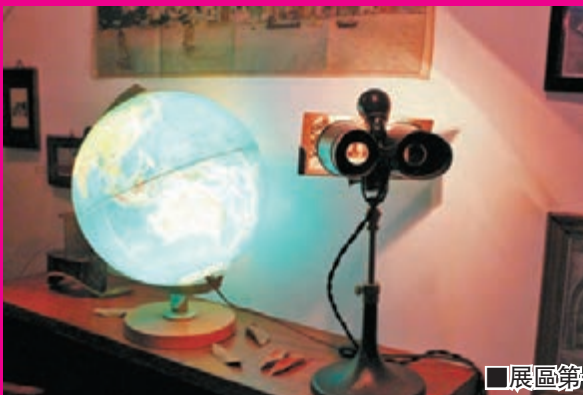
■展區第一部分，營造出懷舊與神秘的氛圍。

「像是動物園」在前身是皇家遊艇會會址的百年老樓中舉辦，共分為三個主要區塊。第一部分是一間燈光昏暗、狹小而精緻，處處透着神秘氣息的小隔間。步入這間小屋後，時光便會悄悄地倒退。在這兒，你會先獲得一張小小的通行證以進入第二個區域。在等待的過程中，你可以從容地逛一逛。研究研究古老的世界地圖、把玩一下舊式望遠鏡，或認真欣賞一番那些熟悉又遙遠的畫作。我們可以模模糊糊地感覺到，這個房間屬於一個有些懷舊的收藏家，這裡呈現出他對正在消逝事物的留戀。但我們心中更多的是期待，期待另一扇門快點打開。