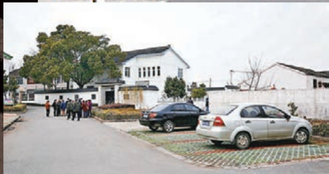
▲周永康老家多年來的訪客近來已經消失。網上圖片