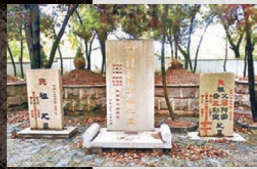
■周永康的祖墳傳因經濟糾紛曾被挖。網上圖片