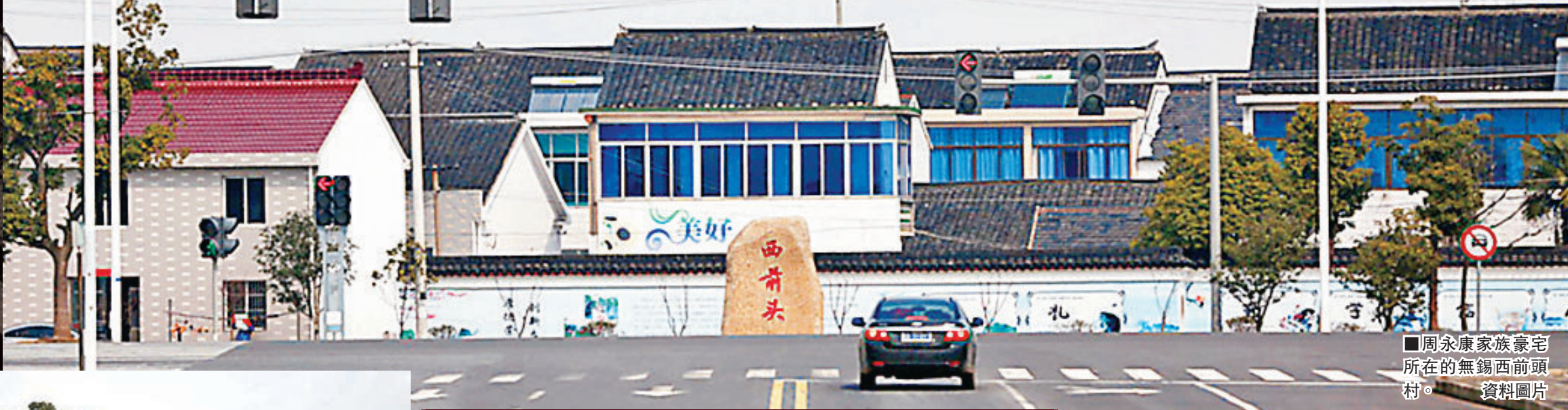
■周永康家族豪宅所在的無錫西前頭村。