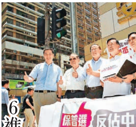
中出會等6個進出口商會會上環擺設街站收集市民反「佔中」簽名。

他勸喻年輕人在考慮參與「佔中」前，須留意會觸犯法律及不要妨礙他人生活，「好似地鐵少少、塞少少，都被人關，但你（『佔中』者）要佔領其他人返學途中地方，點解你（『佔中』者）塞住人又得呢？」