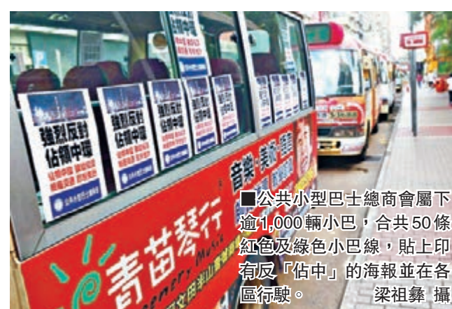
公共小型巴士總商會屬下逾1,000輛小巴，合共50條紅色及綠色小巴線，貼上印有反「佔中」的海報並在各區行駛。

凌志強表示，商會是自費印製海報，並沒有收取他人金錢支援。他們會繼續派發海報給其他小巴司機，司機可自行決定是否貼上，而商會屬下700多輛小巴可自願參加簽名，目前已有400多名會員簽名，「商會沒有規定司機一定要貼海報，有人是持中立就不想貼，目前不超過10輛小巴沒有貼，我們會尊重他們意願。」