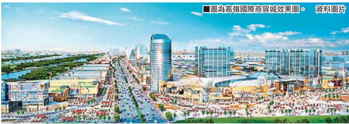
圖為高嶺國際商貿城效果圖。

高嶺國際商貿城位於長沙市開福區金霞經開區，緊鄰長沙中心城區，項目預計總投資500億元人民幣(下同)，規劃建築面積960萬平方米，是集市場集群化、電商產業化、倉儲物流一體化、業態多元化、功能複合化為一體的全產業鏈第五代專業市場，由中央商業區、綜合物流區、會議會展區、總部聚集區、電子商