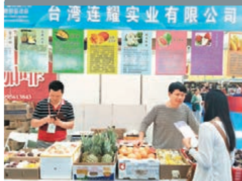
台灣特色水果吸引食客前去諮詢。

香港文匯報訊(記者 朱世強 蘭州報導) 匯聚阿里山的檜木、花蓮的七彩玉石以及愛文芒果、鳳梨