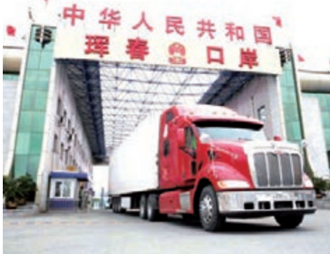
俄羅斯貨車駛入琿春口岸。

琿春市位於圖們江下游，自古以來地處東北亞幾何中心，中、俄、朝三國交界地帶。這裡中、俄、朝三國陸路相連，中、俄、朝、韓、日五國水路相通，居住着朝、漢、滿、蒙等11個民族25萬人口。琿春歷史悠久，可上溯到新石器時代，唐屬渤海國曾建都於琿春八連城。自古以來，琿春就是東北亞地區著名的國際商埠。自秦漢時起，人們就把琿春經俄羅斯至日本的航路稱為「海上絲綢之路」。清朝時期，琿春更是商賈雲集，大小貨船順琿春河入圖們江出海，往來於俄、日各港口及中國沿海城市。琿春國際文化交流，與俄、朝、韓等鄰國民間往來密切，朝鮮族與朝、韓人民語言相通，俄羅斯遊客與日俱增，國際化氛圍十分濃厚。 琿春市委書記高玉龍接受本報記者專訪指出，東北亞區域合作開發當前正處於一個嶄新的歷史時期，中國深化合作的意願更加強烈，中國大力實施絲綢之路經濟帶和海上絲綢之路「一帶一路」戰略，推進沿邊合作開發。國家長吉圖開發開放戰略實施以來，東北經濟振興步伐在逐步加快。現在東北亞區域的交通通道建設每年都有新的進展，都有新的陸路、海上通道、空中航線開通，「長吉圖」發展關鍵在於「圖」，圖們江開發開放的關鍵在於琿春國際合作示範區。因此，琿春是長吉圖戰略的棋眼，也是東北亞絲綢之路的棋眼，一招棋活將帶動全盤。