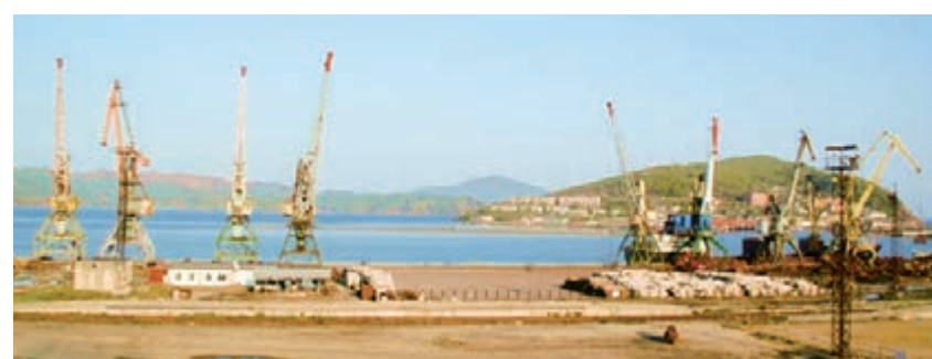
俄羅斯紮魯比諾港。