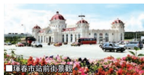
琿春市站前街景觀。