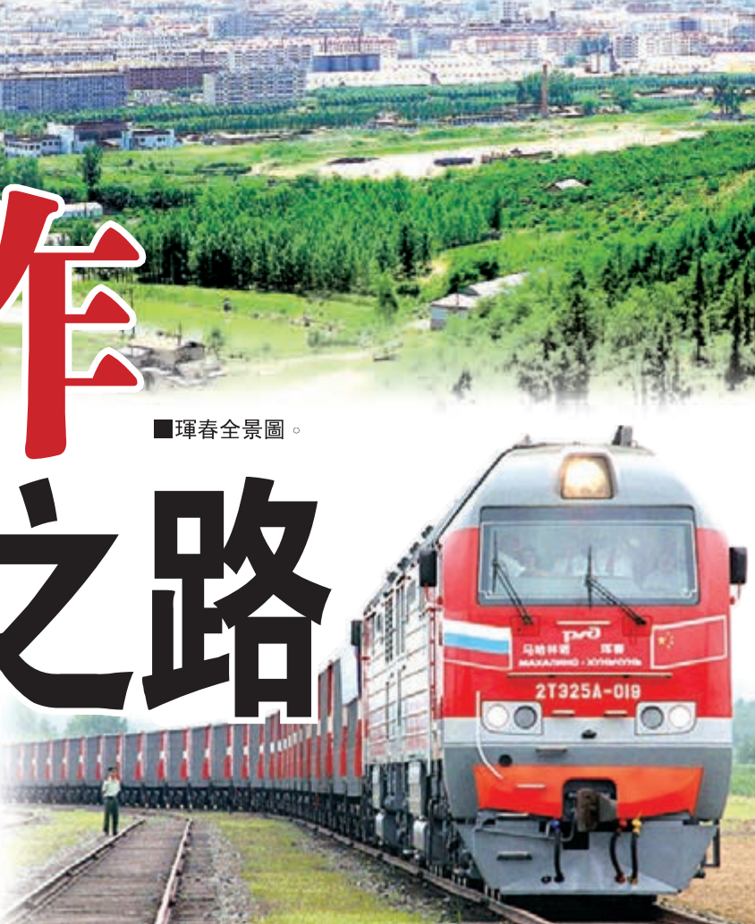
中俄鐵路運輸，今年以來煤炭過貨量越來越大。

文化合作，共同建設大防川國際旅遊合作區，打造帶動東北亞經濟繁榮發展新的增長極，實現與東北亞各國的合作共贏。四是抓城建，打造東北亞國際化明珠城市。抓好城市規劃，完善基礎設施，增強城市的承載能力；加快社會事業發展，提升城市吸納輻射能力，努力把琿春建設成為山清水秀的生態宜居城市、東北亞著名休閒旅遊城市、通達開放的國際合作示範城市、圖們江區域交通樞紐城市，促進東北亞絲綢之路經濟帶的建設發展。