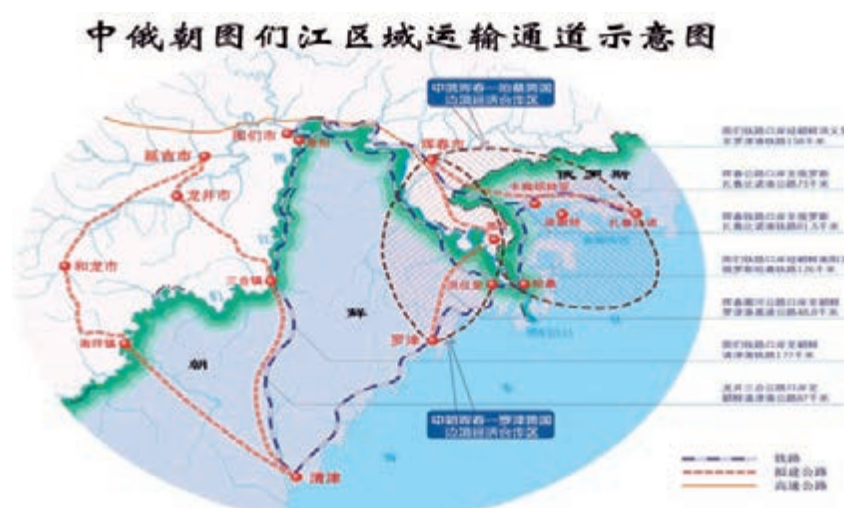
中俄朝圖們江區域運輸通道示意圖。

渤海國人民發展了自己獨特的水上和海上交通運輸，其中優秀的港口是其必備條件。波謝特港，原本的中文名稱為窩關歲，位於圖們江口北側，屬於大彼得灣的一部分，由於波謝特灣口不寬，是保護海港的天然屏障。所以波謝特港是龍原日本道北線航行的最大港口，但因冬季封凍，無法前往日本；龍濟港，位於朝鮮咸鏡北道清津市府居里附近，是渤海國東京龍原府的外港，也是渤海國南海的最大港口，主要用於各府州間的近海航行和前往日本的遠航。從唐朝輸入的物品也由渤海國東京龍原府的外港輸送到日本，日本道在渤海國「絲綢之路」的主導作用也由此而來；吐號浦港，渤海國時期南海最大的港口之一；金野灣，經常用於近海航行，主要負擔渤海國與後期新羅的海上聯絡。