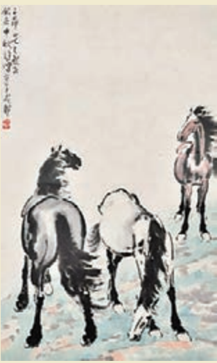
■ 徐悲鴻《春江飲馬圖》

中國古代書畫專場推出拍品196件，以明清文人作品為主打，為藏家提供了一個有品位及深度的古代書畫藝術交流，總成交1億2,700萬，成交率：66.33%。中國古董珍玩專場珍玩佳品良器既多，推出拍品330件，總成交逾9,844萬。此次的古董珍玩除常規瓷器、玉器、古董之外，主推金石、文房、金銅造像三個專題以及兩個專場，每一個單元皆有不俗之作：清乾隆銅鑲金十一面觀音像，工藝精湛，保存完好，體量較大，是不可多得的清代宮廷造像典範之作。西周早期的青銅梁盃，經朱善旗、吳式芬、吳大澂、羅振玉、劉體智等人遞藏或寫入研究性書錄，可謂流傳有序，成交價138萬。另外一件銘文為「亞古父己」的青銅觚，成交價138萬。宋代「八極引」琴為嶺南琴家盧家炳舊藏，斷紋優美，九德俱全，展覽多次，琴學著述和音像皆有出版。