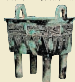
■ 商晚期/西周夔龍紋方鼎

夢蝶軒藏中國古代青銅器專場，中有一組商晚期至西周時期的小型祭器頗有特色。此組祭器共七件，分別為：對觚、對角、一簋、一尊和一方鼎，七件器物上均帶有相同銘文。