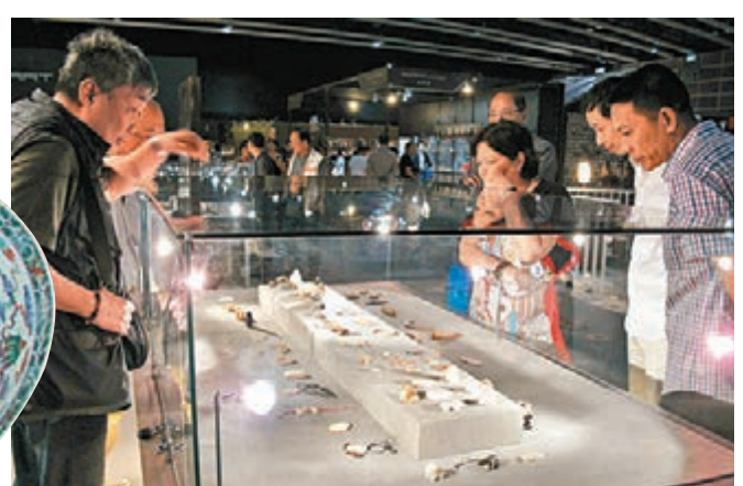
■ 一眾嘉賓欣賞各式各樣精挑細選的藝術古玩

今年古玩展的展場開闊，雖然今年展會的參展商，比去年的五十多家增加了逾二分之一，但佈局恰當，更顯得疏落有致，其擺設本身就是一場視覺藝術盛宴當然，各參展商也落足心思為古玩珍品，找個適當的佈