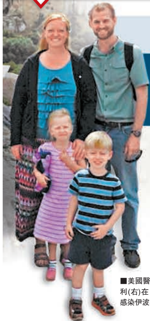
美國醫生布蘭特利(右)在日前確診感染伊波拉病毒。