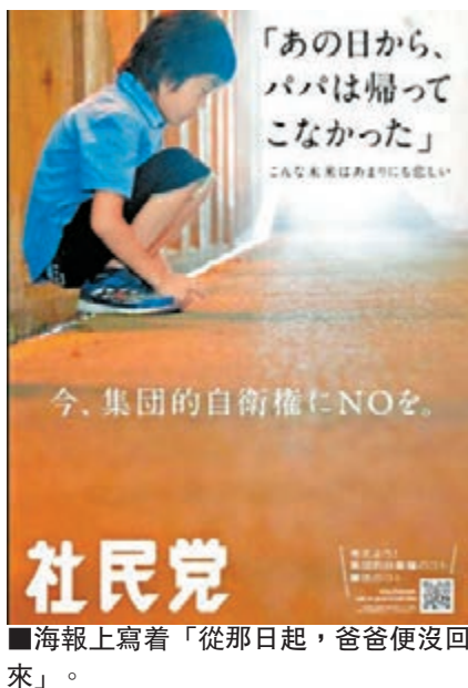
海報上寫著「從那日起，爸爸便沒回來」。

「從那日起，爸爸便沒回來」、「這樣的未來實在可悲」，這些都是日本社民黨月中發布反對解禁集體自衛權的海報上注上的語句，內容正引發熱議。海報暗示解禁後可能使派往海外的自衛官在戰鬥中喪命。該黨黨魁吉田忠智解釋：「雖然內容具有刺激性，但自衛官犧牲的可能性確實增加。」海報上還印有蹲在路邊悶悶不樂的男童，據社民黨稱，該男童設定為自衛官的小孩，表達家人的痛苦情緒。海報發布後，自衛隊出身的自民黨前防衛政務官佐藤正久反駁稱對此感到憤怒和悲哀。他在微博表示擔憂，稱這沒有顧念自衛官及其家人的人心。共同社