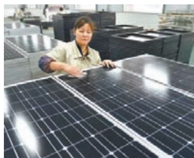
■中美光伏問題若繼續升級，最終將使兩國光伏上下游產業受到傷害。圖為山東一家光伏企業。

香港文匯報訊(記者 馬琳 北京報道) 中美光伏貿易爭端再次升級。美國商務部近日對中國輸美光伏產品的「雙反」調查作出傾銷初裁。中國商務部貿易救濟調查局負責人昨日就此發表談話指出，中方對美方再次對中國光伏產品發起雙反調查、放任光伏貿易摩擦不斷升級的做法表示強烈不滿，並指出美方的做法是在濫用貿易救濟措施。