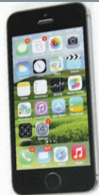
■蘋果移動操作系統iOS被發現有三大「網上圖片後門」程式，會導致私隱被竊取。圖為蘋果手機。

香港文匯報訊 法國研究人員近日在蘋果移動操作系統iOS中發現多個未經披露的「後門」，他指這些「後門」可以讓美國國家安全局和黑客在用戶不知情的情況下，通過WiFi秘密竊取電話、短信記錄等多達44種用戶信息。內地專家則呼籲，公職人員禁用蘋果手機，換用國產手機。