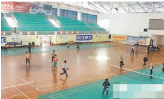
■湖北推出「去運動」APP，方便民眾預訂體育場館。圖為湖北一所體育場館。

為破解這矛盾，湖北省創新社會管理模式，由湖北省體育局、荆楚網共同開發，歷時半年，成功打造「去運動」APP服務平台。該平台簽約全省100餘家運動場館，從本月13日起分時段免費對公眾開放。湖北省體育局在這個平台上，推出優質場館、專業教練及權威運動專家為老百姓服務，市民