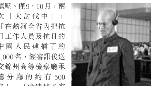
■日本戰犯原弘志當年在法庭上作陳述。

鎮壓。僅9、10月，兩次「大討伐中」，「在熱河全省內把抗日工作人員及抗日的中國人民逮捕了約1,000名，經審訊後送交錦州高等檢察廳承德分廳的約有500名」，「當逮捕及審訊這些人時，對於和平的中國人民加以虐殺、傷害、放火、破壞、拷問(灌涼水、洋油、抱重石、用火筷燙身)等慘無人道的暴行」。