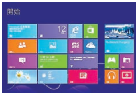
■window8的開始畫面。

但科技業內人士多認為，Windows 8無法保證社交網站完全安全，難以避免會有惡意內容乘虛而入，危及計算機用戶安全。又如，Windows 8允許用戶通過雲共享內容，容易導