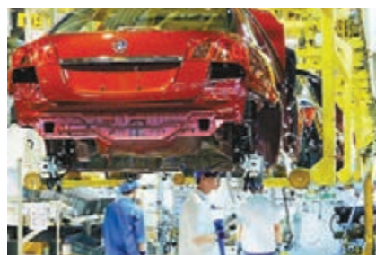
■2013年年末，國企職工人數共達3,698.4萬人。圖為上海一汽車生產車間。 資料圖片

新華社報道稱，數據顯示，2013年，全國獨立核算的國有法人企業15.5萬戶，同比增長5.8%。其中，中央企業5.2萬戶，同比增長7.2%；地方國有企業10.4萬戶，同比增長5.1%。到2013年年末，全國國企職工人數3698.4萬人，同比增長0.7%。其中，中央企業1762.9萬人，同比增長1.3%；地方國企1935.5萬人，同