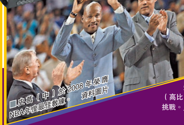
史葛(中)於2008年榮膺NBA年度最佳教練。資料圖片