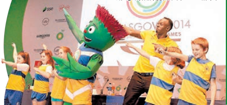
保特(右三)與大會吉祥物做出「飛人」的招牌慶祝手勢。新華社

說,保特能亮相已算是偉大的勝利。他表明,到格拉斯哥就是為了參賽,故必會落場跑。最後,被問到他所關心的曼聯,他答道:「我相信(新領隊)雲高爾,我也依然支持曼聯。世界盃我支持阿根廷,我認為發揮最好的是美斯,當然(荷蘭前鋒)洛賓也很出色。」 ■新華社