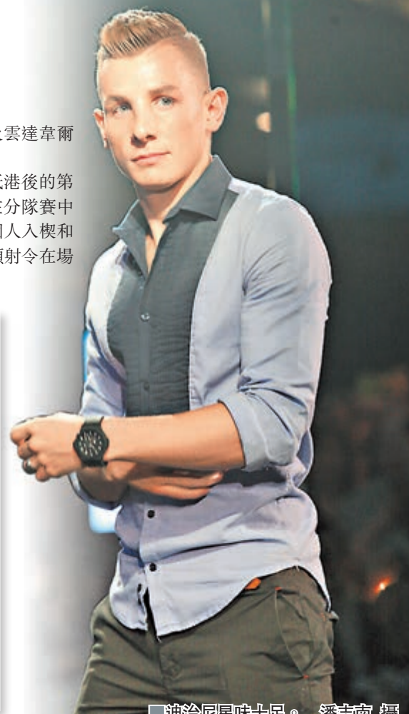
迪治尼星味十足。