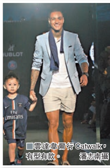
雲達韋爾行Catwalk,有型有款。