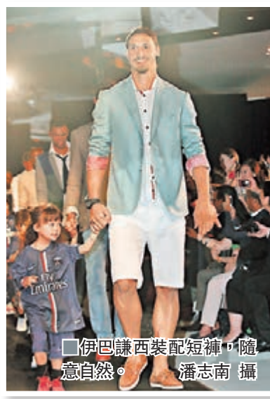
伊巴謙西裝配短褲,隨意自然。