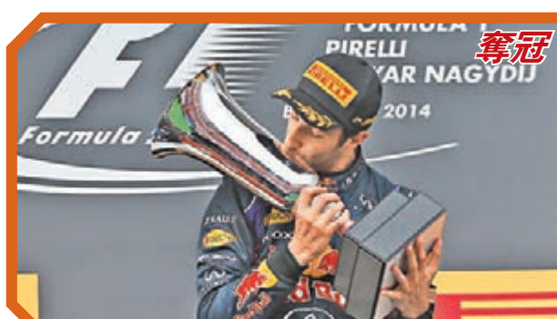
昨晚F1匈牙利站正賽在亨格羅林賽道舉行,紅牛車隊澳洲車手列卡度藉倒數第四圈連續超车獲得第二個分站冠軍,法拉利車隊艾朗素得亞軍,季軍是尾位起步的平治車手威美頓。 ■美聯社

界波與巴西球星朗拿甸奴2002年世盃對英格蘭的妙射相提並論,因此他獲得亞洲罰球王的美譽。2008年,他首次入選香港代表隊。 ■綜合外電