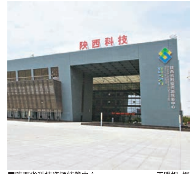
陝西省科技資源統籌中心。