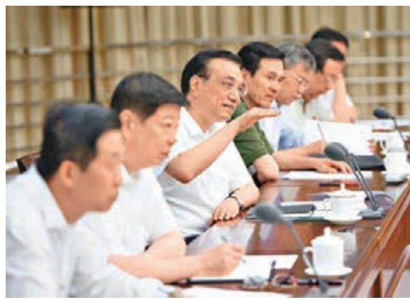
李克強與新登記企業負責人座談。

香港文匯報訊 據中新社報道，中共中央政治局常委、國務院總理李克強近日出席新登記企業負責人座談會。實施簡政放權特別是改革商事登記制度以來，今年上半年內地新登記企業168萬戶，同比增長57%。其中新登記私營企業158萬戶，從業人員達1009萬人，同比增長43%。新增就業超過去年同期，簡政放權及相關改革發揮重要支撐作用。而李克強在座談會中表示，要讓新創企業在公平市場競爭中成長壯大。