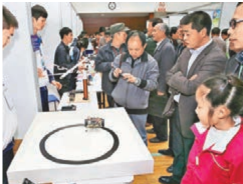
陝西首屆青少年科技創新大賽今年舉辦。