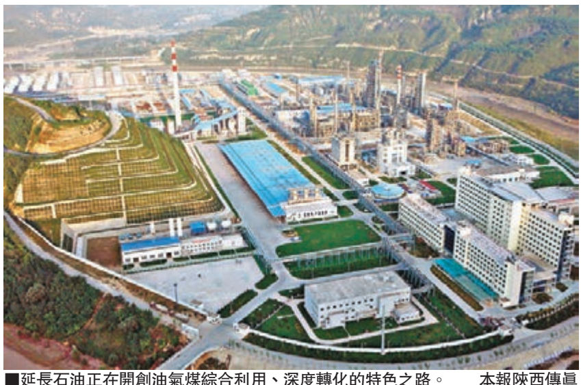
延長石油正在開創油氣煤綜合利用、深度轉化的特色之路。

此外，所謂「延長模式」，即陝西省科技廳與延長石油共同設立「延長能源化工專項」，由科技廳出資4000萬元、延長石油投入20億元、吸引省內外10多家科研院所參與，聯合開展關鍵技術研發，創造了政策、資金、技術、人才等資源高效集成的科技創新新模式，也被譽為破解「陝西現象」的「延長模式」。